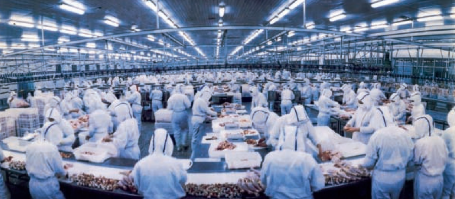
現代化禽畜加工產業

用柴禾燒的火炕，柴禾燃燒後的眾多有機物質、元素，附著於炕洞內，掏挖出累積的炕土，也成為上好肥料。至於做飯做菜燒炕殘留的草木灰燼，則是農民種植穀類、瓜類等的良肥，這與台灣以往在收割後的稻田燃燒枯稻稈一樣，利用燃燒後的灰燼肥田。不過農田秸稈燃燒，要注意不能在快速道路與高速公路旁燃燒，避免煙霧瀰漫遮蔽駕駛視線，影響行車安全。