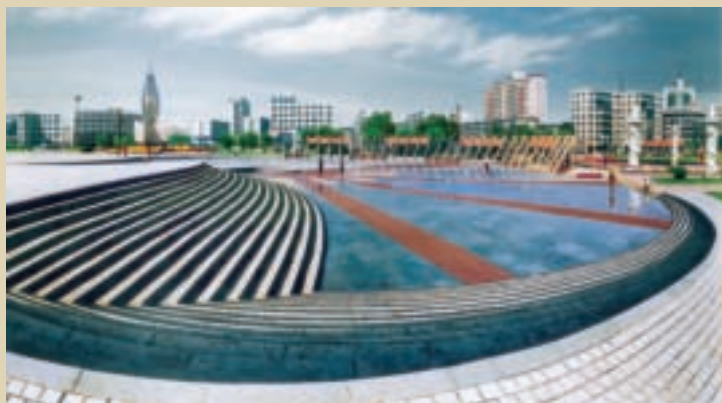
新鐵嶺以水作文章

與大陸眾多開發區相較之下，鐵嶺經濟技術開發區乃是一個較具特色的開發區。該開發區是遼寧省唯一的國家級生態示範區與農牧業高新技術開發區，她曾在第二屆亞洲品牌盛典的國際競賽活動中，榮列為「中國十大最具競