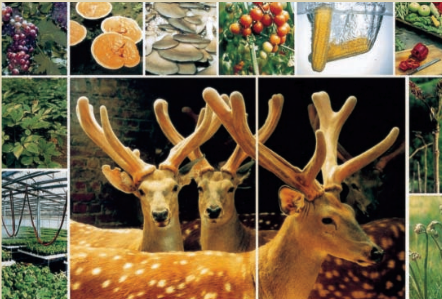
鐵嶺的特色農產品