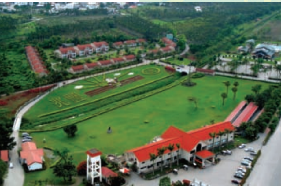
從空中鳥瞰新光兆豐休閒農場