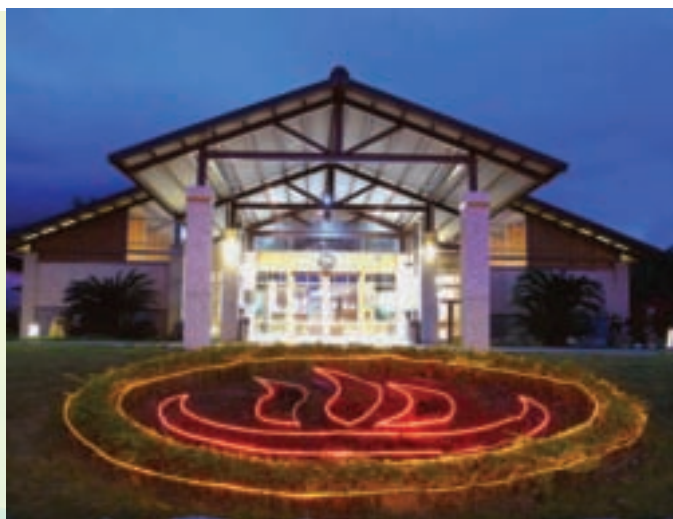
溫泉會館外觀夜景