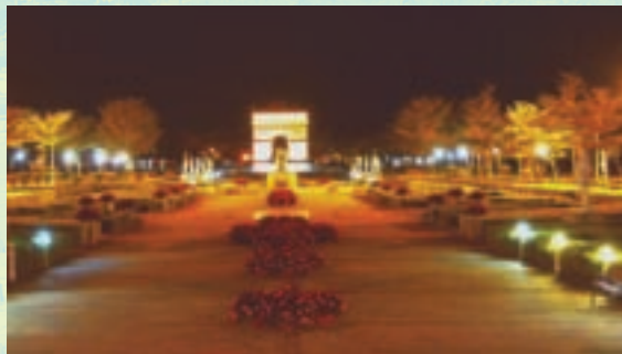
歐式宮廷花園夜景