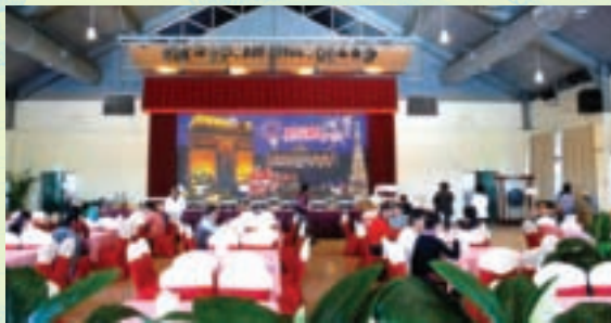
提供餐飲服務的豐年廳