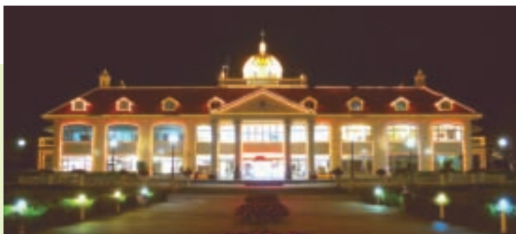
遊客服務中心夜景

一嚐收成的喜悅。60公頃的果園中，栽種酪梨、無子檸檬、糖橙、金棗等20餘種各式水果，在不同的果樹區，均設有大型解說看板，詳細介紹各種果樹的生長狀況、營養價值等資料，並提供遊客免費品嚐。由於農場的果樹皆施用自製的有機肥料，果實味香甘甜，讓遊客吃得健康又自然。