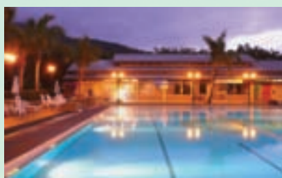
溫泉會館旁的「舒活館」