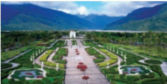
歐洲宮廷設計風格的景觀花園

坐 落於花東縱谷的新光兆豐休閒農場，是國內少見的大型觀光農場之一，也是花東縱谷內相當知名的休閒去處。