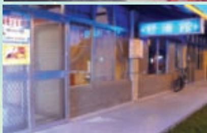
舒活館提供精油芳療服務

新光兆豐休閒農場溫泉會館內的溫泉，泉水是源自中央山脈二子山的水脈，是於民國89年，邀請日本探勘溫泉的專家，費時近2個月的時間，於地底1520公尺處，成功鑽鑿出來的溫泉。經「台灣大學嚴慶齡工業發展基金會合設工業研究中心環境品質檢驗室」的檢驗報告指出，其溫泉水質為PH值7.1，屬微鹼性的碳酸氫鈉溫泉，對皮膚有滋潤的功能，可讓皮膚的角質層變得柔軟、光滑水嫩。經常泡洗，對皮膚有滋潤、漂白的效果。而燒燙傷等外傷患者，常泡洗也有改善消炎、去疤痕的功效，因而有「美人湯」之稱。