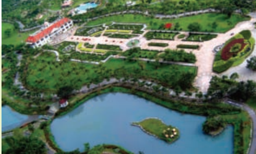
空中鳥瞰四秀湖區

度假木屋區： 在夕陽餘暉中回到玫瑰園、荷蘭村住宿區，歐式建築的度假木屋，提供寬敞舒適的居住空間，坐在湖中小亭，迎著陣陣微風，享受農場特有的寧靜。清晨，在海岸山脈的第一道曙光醒來，漫步於農場四秀湖的湖濱小徑，看萬隻錦鯉光彩爭豔，欣賞黑天鵝、白天鵝於湖中悠游，遠離塵囂，與大地一起深呼吸。