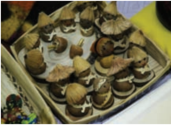
檳榔娃娃可愛討喜，小朋友diy愛找它