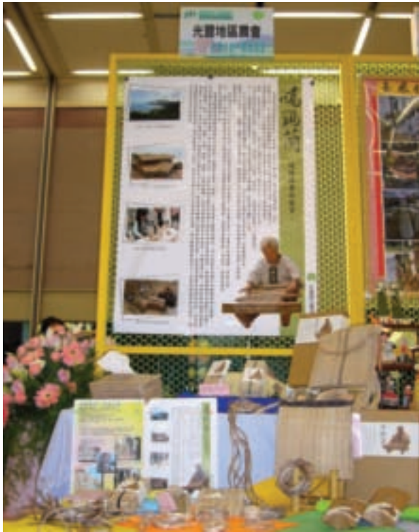
豐濱噶瑪蘭家政班的香蕉絲在全國休閒創意大賽中得第一