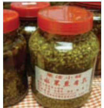
水果婆婆的水果豆腐乳逐漸量產，很美味

有的家政班員說：過生日也從沒這樣受重視過，從大門口走到典禮會場好像在走金馬獎星光大道，覺得自己好像是大明星，很光采，當花蓮的農民真幸福。