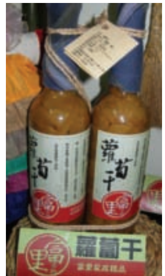
富里的古早味蘿蔔乾曾在加拿大引起轟動，在國內也很熱門