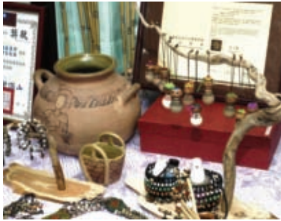
陶土娃娃裡面裝精油，隨時散發香氣

幽默。光復大同家政班員平均年紀稍長，報告人戲稱自己的班員年紀加起來是「格格千千歲」；一位班員說，為了參加考評，已經有3天都沒有和先