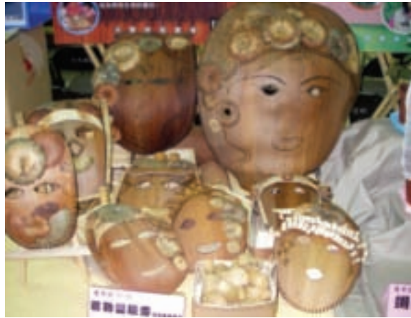
檳榔葉鞘面具也是冠軍

這幾年，家政班員參加各項研習，農村婦女走出傳統的小圈圈，進入人群中，展現出前所未有的自信美，也有助於花蓮整體農業升級。