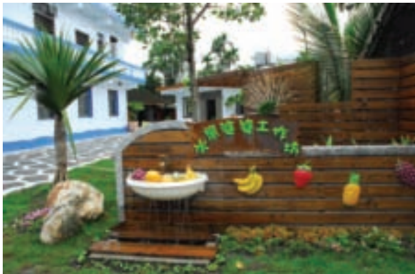
水果婆婆以水果裝飾門面，產品都以水果為主，好吃又好玩