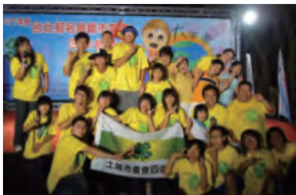
參加農會聯合成果展的人來個大合照吧