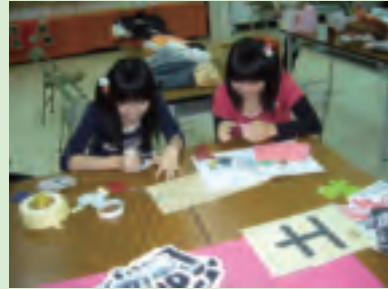
繪畫剪貼工夫不可少，才能佈置出美美的會場