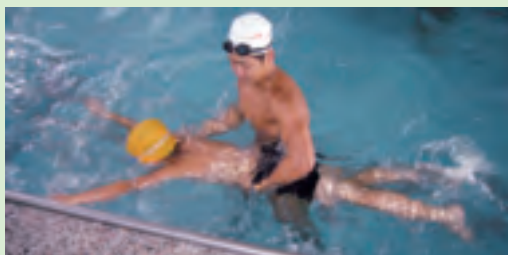
游泳研習班的教練正進行指導