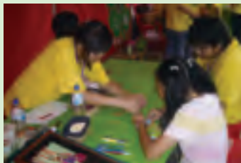
DIY教作幸運精油福袋