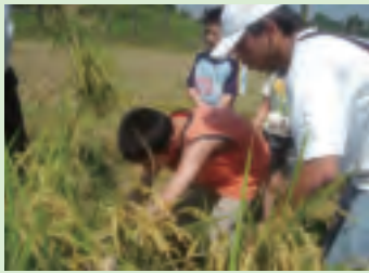
活動企劃作業組成員協助小朋友體驗割稻