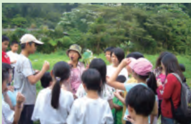
生態講習讓大家对大自然景觀有更多認識