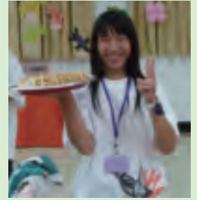
活動企劃作業組成員要負責「跑堂」的工作

機，只是不希望遺失早期一些美好的感覺，並希望達到傳承的目的，現今社會上的摩擦不勝枚舉，需要一些美好的事物作為潤滑劑，讓人活得更自在快樂。