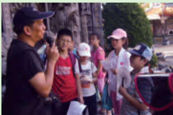
話我家鄉作業組讓大夥更深入了解家鄉的風土民情