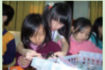
活動企劃作業組成員協助各種研習指導