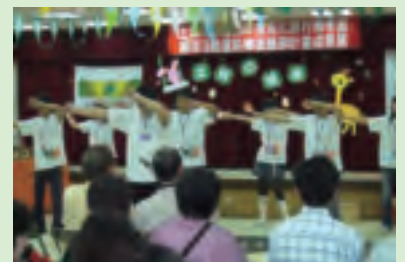
短短幾分鐘的舞蹈表演，在台下可是練了好久