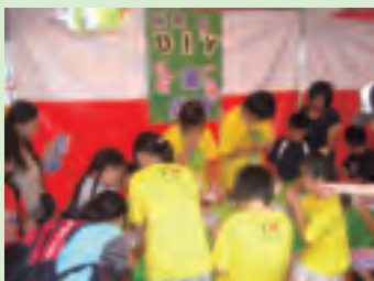
土城市農會的DIY攤位極受歡迎，人潮不散