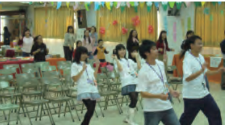
能歌善舞是必備技能，平時就得多加練習