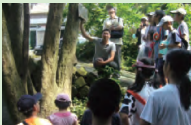
帶領大家到大自然探索昆蟲的生態