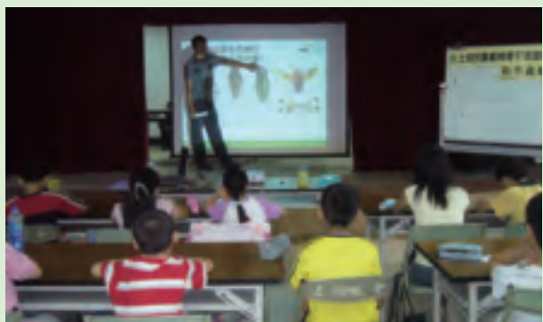
「都市蟲鄰」作業組，透過幻燈片深度介紹昆蟲