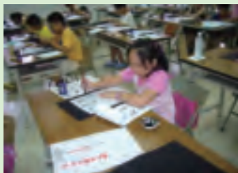
畫法研習班可沈靜浮躁的心

將經常參加類似活動，因為這些活動讓他們過得很充實，往後帶領別人也較為得心應手，而這也是大多數人的心聲。