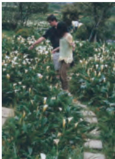
由貴子坑可以順道一訪竹子湖

用心及付出的心血，各農漁村的齊心努力與配合，讓台灣的鄉村有今天如此活潑嶄新的面貌。我們感動之餘，也盼望並期待陸續的有更