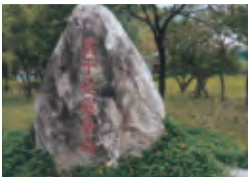
露營區是最佳休憩所