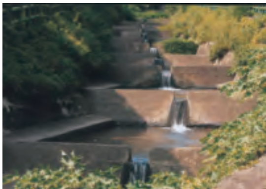
貴子坑溪整治成功