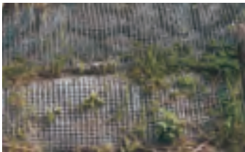
加勁網格是水土保持最佳措施