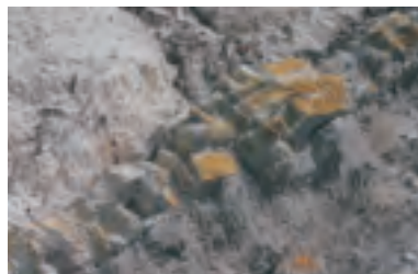
北投區盛產的琉磺礦