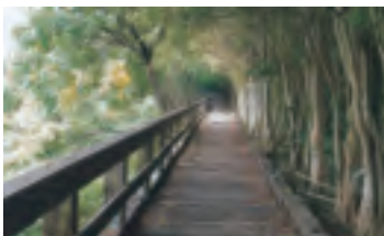
五指山層觀察棧道

位於北投區西北角、貴子坑溪與水磨坑溪兩溪會流處的貴子坑，竟然是全台第一座戶外教學園區，這也是在走過十大經典農村、見過無數水保戶外教學園區後，才知道它的始祖在這裡呀！這裡可以見到地球上數百萬