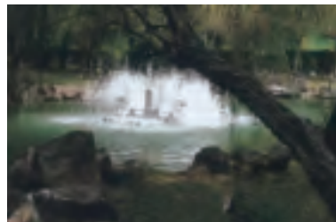
貴子坑的生態水池