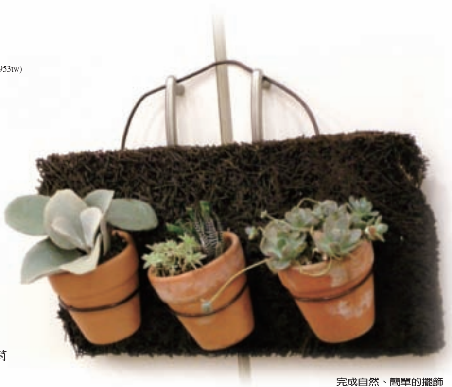
完成自然、簡單的擺飾