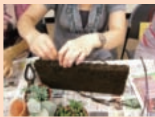
3. 穿過鋁線作成把手狀