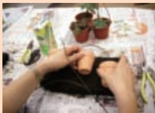
5. 3個素燒盆，先決定擺放的位置