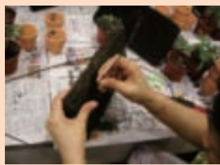
2. 利用剪刀或較硬的蘭花支撐鐵絲穿洞