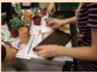
1. 蛇木板是很好運用的材料