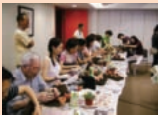
9. 3個素燒的位置，每個人都不一樣