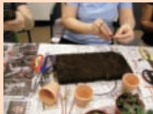
7. 剪好適當長度的鋁線