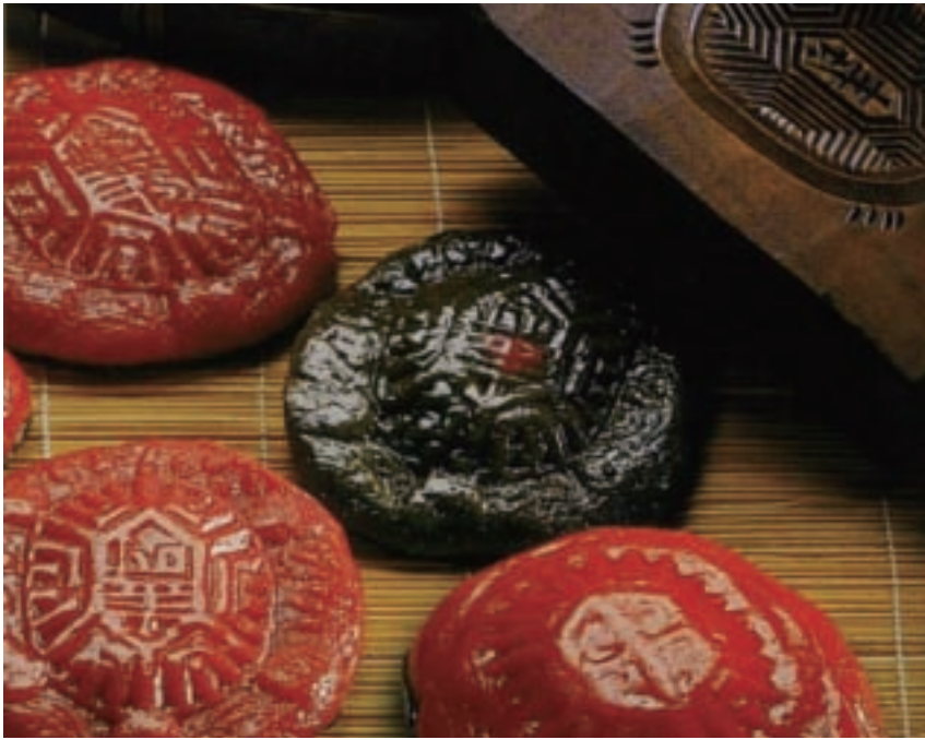
祝壽用的「紅龜粿」是用糯米做的。

成千上萬的米神廟，甚至以「麻糬」作為過年食品。日本曾經有人出過一本書，書中提到：「以米為主食者比以麥為主食者平均多活20歲！」因為米是整個顆粒完整吃下，而麥需要經過磨碎等許多道過程，再發酵製作成麵條、麵包、包子等麵食品才拿來食用，然而，經過幾道加工程序後，麥子所含豐富的營養將會流失很多。在台灣，年長者參加宴會時若不吃一碗飯就像沒吃飽似地，回家還要補吃一碗飯才覺得飽。