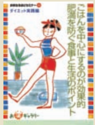
宣傳「吃米減肥美容」的明信片！