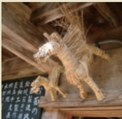
用稻草做的動物來祈福是日本農家的一項傳統。