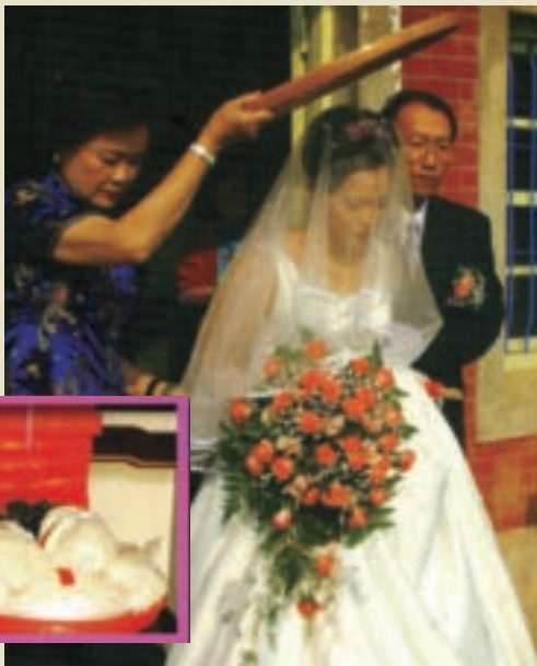
婚禮中，撒一把米用來傳達祝福