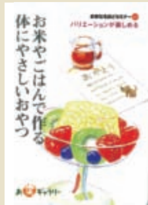
日本政府發給每個小學生的「鼓勵吃米健康卡片」！