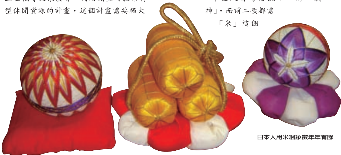
日本人用米繩象徵年年有餘