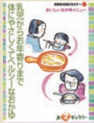
從嬰兒到老年人都需要「灌米湯」！