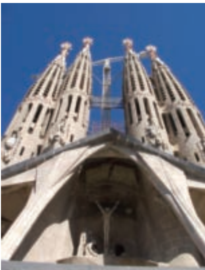
蓋了五百年還沒完成的世界建築奇蹟—聖家堂。