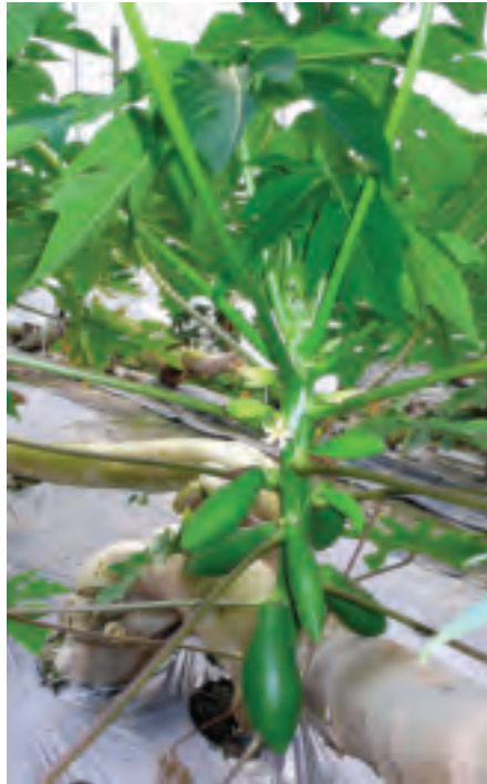
在株幹部位再長出第二代新株