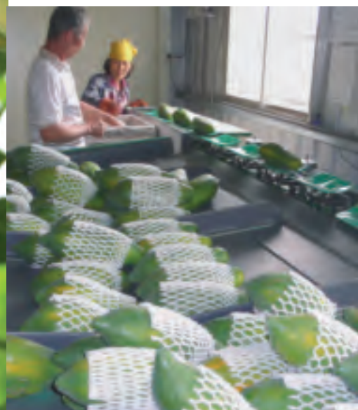
採用木瓜選別機分級處理