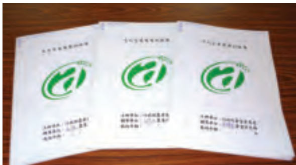
木瓜產銷履歷紀錄簿