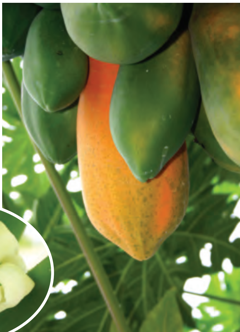
高樹果樹產銷第50班主要栽植木瓜果樹