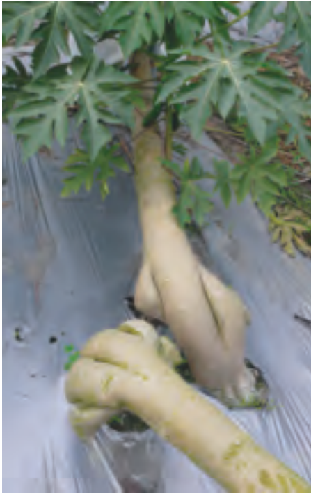
以「剖頭」手術進行倒株處理使植株矮化生長