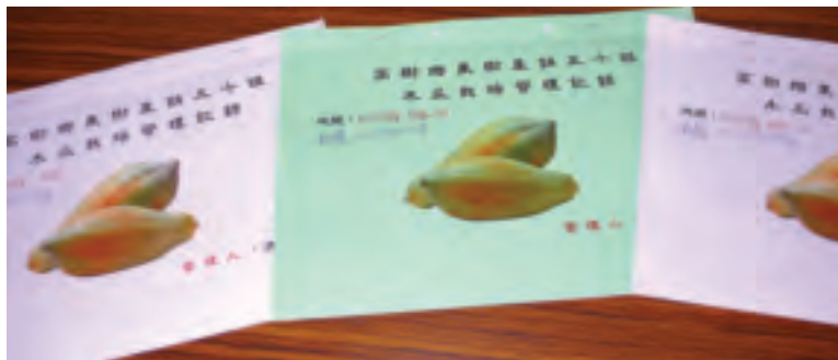
木瓜栽培管理紀錄簿