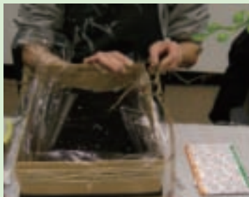
8. 利用苔木及鋁線，配合盒子大小作成井字，苔木前端的細枝位置在作品的正前面