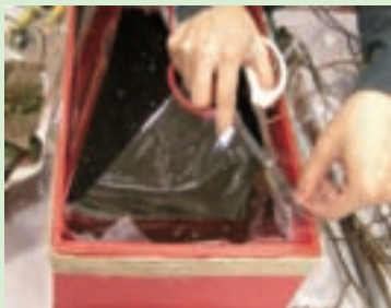
7. 剪掉超過盒子高度的玻璃紙