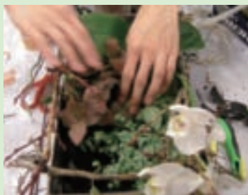
10. 種入蝴蝶蘭，白網紋、紅網紋及白雪蔓，儘量種低一點