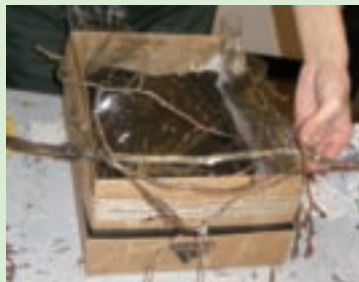
9. 利用鋁線綁好，苔木細枝呈自然交錯