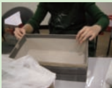
2. 貼上雙面膠後黏上麻繩