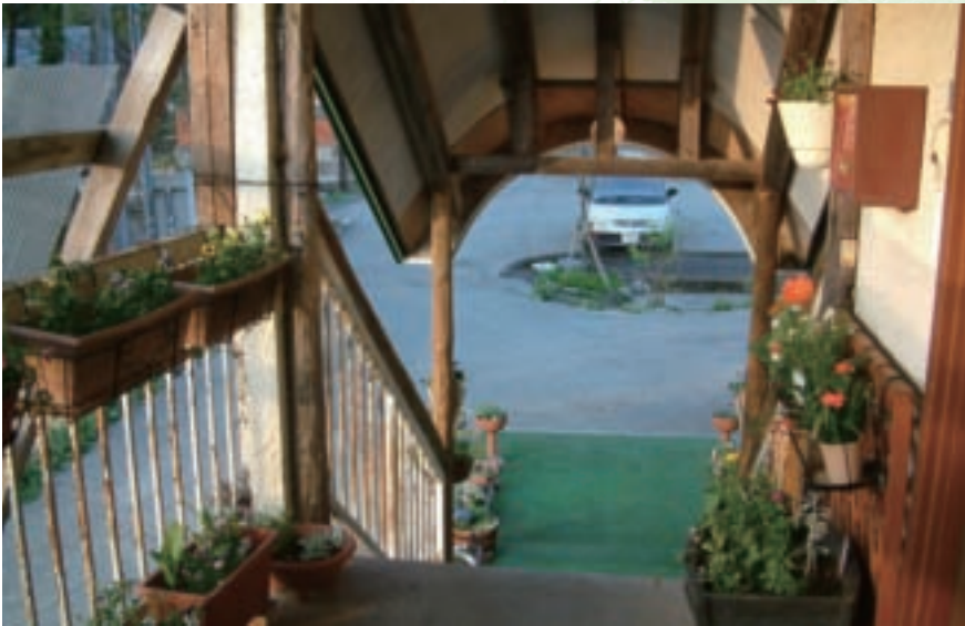
中介空間的營造，創造了最高的休閒氣氛