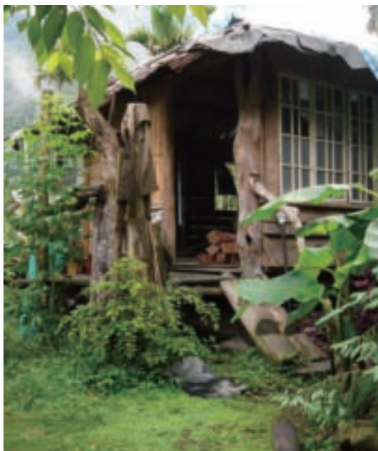
鄒族人蓋的小木屋，別緻吧！

第二德是「敏」，敏銳。我們中國人說「一葉知秋」，史上所有皇宮庭院中的樹林裡一定要種植梧桐樹，北方入秋後，庭院中最