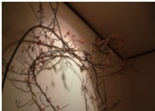
用結實累累的枝條來佈置這面牆

找到梧桐樹才願意停在枝頭上。其重要性可見一斑，這也是我長此以來經常拿來鼓勵畢業生就業方向與理想的例子。