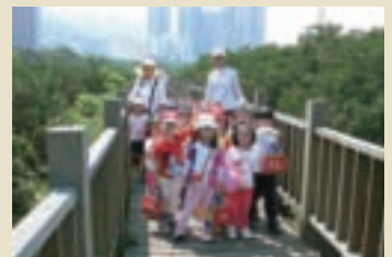
淡水河紅樹林提供學童戶外教學功能

行政院農委會林務局在台北捷運淡水線的「紅樹林站」2樓，開設「紅樹林生態展示館」，館內設有紅樹林生態展示區、視聽室，介紹紅樹林自然景觀、水筆仔生態保育等資訊設施。館外頂樓停車場旁設有賞鳥高台，可以俯瞰淡水河、觀音山、八里、關渡大橋等景色。