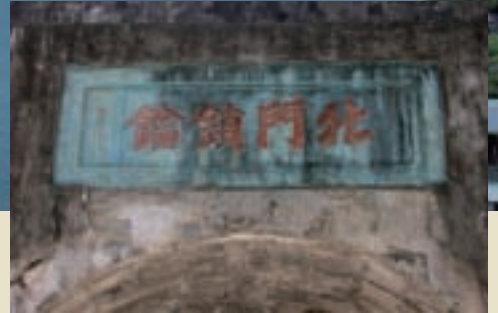
滬尾砲台城門上「北門鎖鑰」題字

淡水古鎮內的滬尾砲台，創建於光緒12年（1886），劉銘傳為「師夷之長以制夷」，特別聘請德籍技師鮑恩士（Bonus）負責督造新式的砲台，並由國外製造大砲的工廠派火砲專家前來勘驗。光緒15年（1889），阿姆斯特壯後膛鋼砲安裝完成，成為捍衛台北的門戶。甚少題字的劉銘傳，見此砲台規模宏偉，特別在城門上額題寫「北門鎖鑰」四字，可見其受重視的程度。