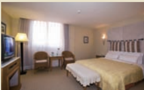
《花間·水岸》雅緻客房