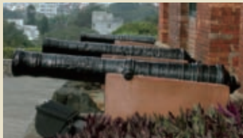
紅毛城保留的古砲