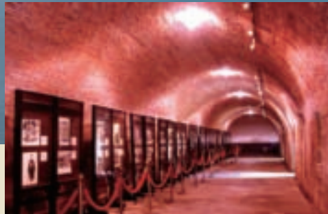
滬尾砲台殘留的甬道