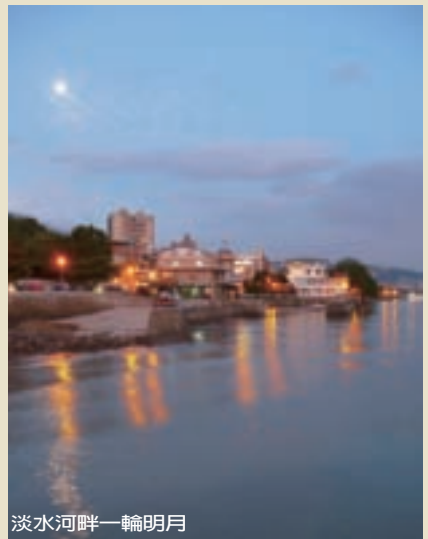
淡水河畔一輪明月