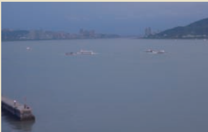
往來淡水河的渡輪