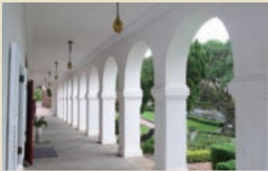
前清淡水總稅務司官邸弧形拱圈具協調柔和之美