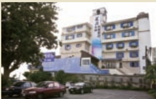
《花間·水岸》旁方便停車