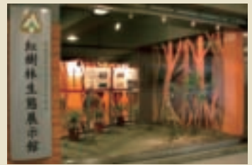
紅樹林生態展示館