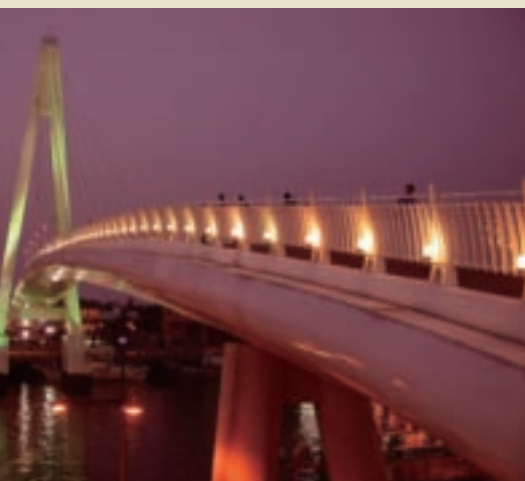
漁人碼頭港區渠道上的「情人橋」

多功能的「淡水漁人碼頭」座落於淡水第二漁港，倚淡水河出海口的右岸，東有綿延的大屯山脈，西邊則隔著淡水河與觀音山相望。港區渠道上的「情人橋」完工，以及啟動「藍色公路」後，讓遊人乘風破浪遨遊淡海，使得漁人碼頭成功轉型為觀光休閒碼頭，而充滿異國風情的美景，更帶動周邊的交通與觀光人潮，成為北台灣最熱門、最受歡迎的休閒景點。