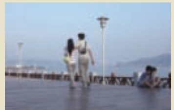
淡水漁人碼頭棧道情侶雙雙