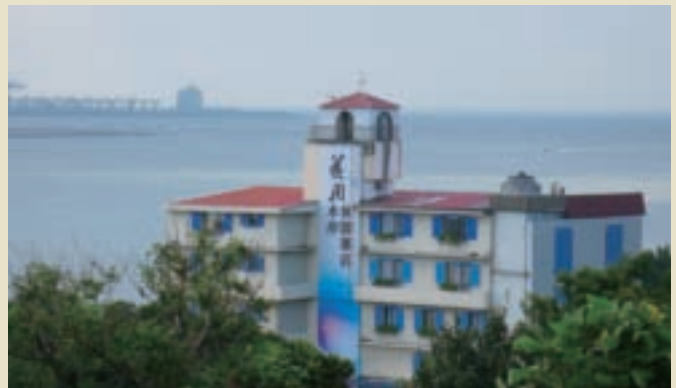
依傍淡水河的《花間·水岸》

月；從透明落地窗揮灑進來的月光明亮迷人，何不洗個月光浴？在臨靠淡水河的觀景台，明月伴隨著海風與花香，別忘了河面上，還有一輪倒影的明月.....。有多久沒有好好地看過月亮？即使工作再忙，也該為生活添加點愜意調味，《花間·水岸》邀您在水畔一同賞星攬月！