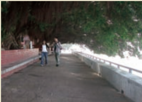
淡水河畔的榕樹道