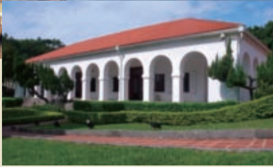
前清淡水總稅務司官邸外觀