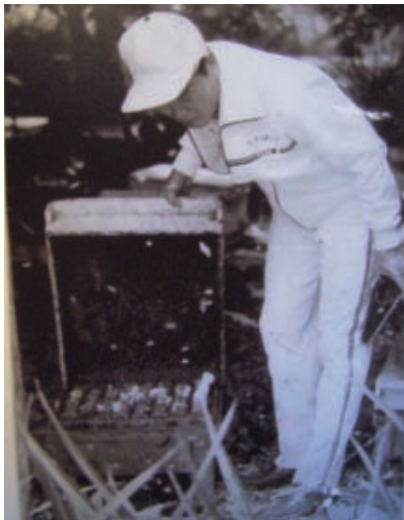
最早的養蜂人照片

質純味美的蜂蜜，採低溫濃縮而成，保留蜂蜜原有的氨基酸、維生素、礦物質和酵素活性。