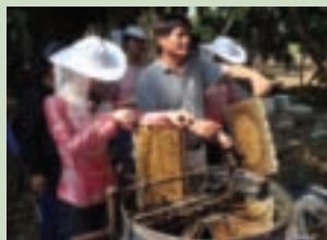
將巢脾放入離心機中