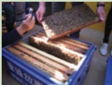
自蜂箱取出蜂巢脾