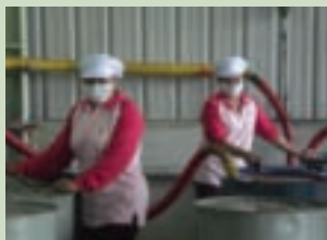
將取得的蜂蜜低溫濃縮