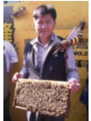
博士展示蜂箱巢脾

強化台灣自有優質品牌的研發能力，蜜蜂故事館的產品相當多樣化且吸引人，在蜂蜜、花粉、蜂王乳、蜂膠主產品以外，副產品琳瑯滿目，有蜂蜜醋、軟糖、喉糖、脆餅、蛋捲、豬肉乾、蛋糕、冰淇淋、天然手工皂和蜂蜜香橙雞腿等調理包，地下室餐廳的菜色則有檸檬蜜愛玉、麻油蜂子、荔枝蜜蒜蒸大草蝦等蜂蜜的滿漢大餐。