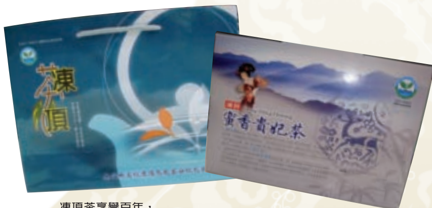
凍頂茶享譽百年，且國內外知名