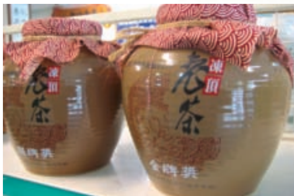
凍頂壺裝老茶，已有相當年份