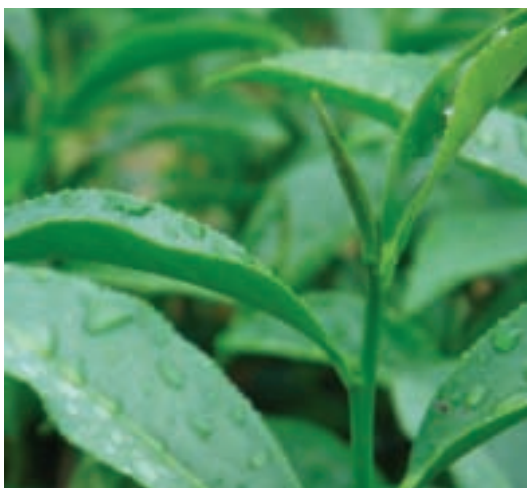
帶著雨露的茶菁，蒼蒼翠翠