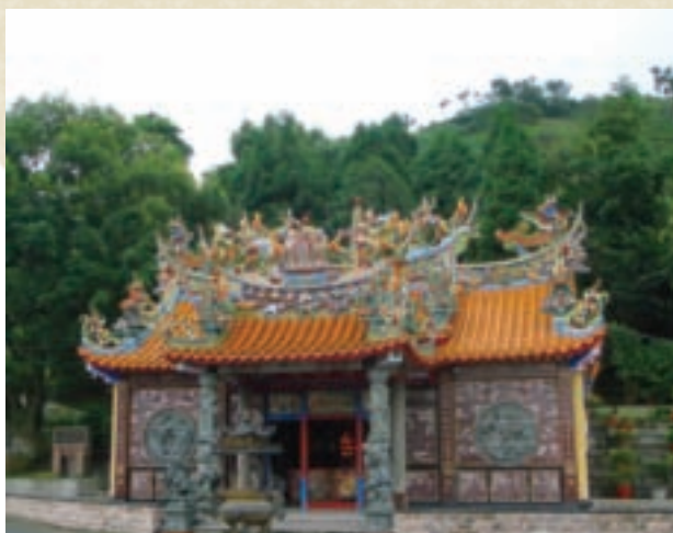
鹿谷鄉的古蹟—開山廟

題，搶攻年輕客群意圖不言可喻。年輕人喜好新奇事物，星座又是共通話題，同學好友生日，贈送對應其星座的固形茶精緻禮盒，高雅又貼心，賣點十足。此外，老牌茶客通常口味穩定，扭轉其根深蒂固的消費習性並不容易，茶中新客勇於嚐鮮，對於新茶品接受度高，更具開發空間。