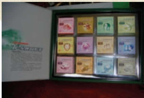
禮盒內裝12塊茶磚，以十二星座包裝

經過多年擴展，鹿谷鄉茶區早由麒麟潭邊的凍頂山頭、山麓向四方延伸，面積廣達2,000多公頃，年產茶葉約2,000公噸。