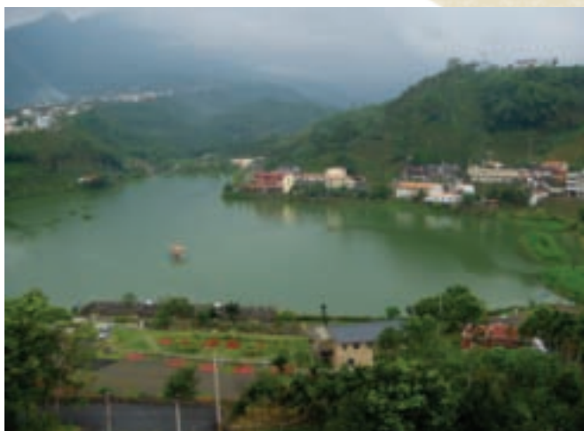
凍頂山雲霧繚繞，依偎著麒麟潭