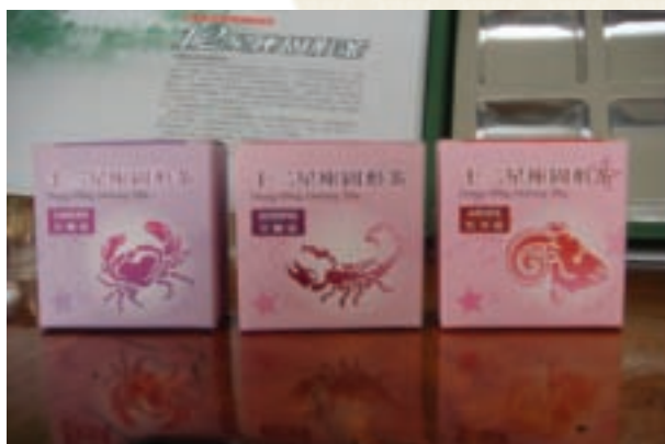
茶磚小盒包裝，十分可愛