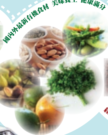
國內外最新有機食材 美味養生 健康滿分