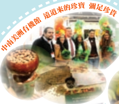
中南美洲有機館 遠道來的珍寶 彌足珍貴

中南美洲當地養生食材及咖啡豆現場由專家學者解說、台大生命科學院微生物與生化研究所策劃的紅麴主題館帶您一探古法養生奧密、日本100項暢銷保健自然食品、澳洲明星級有機芳療帶您體驗 0~100歲皆有的保養趨勢、五星級名廚現場烹飪秀，最新又具實用性的有機養生潮流及商機一次盡覽！