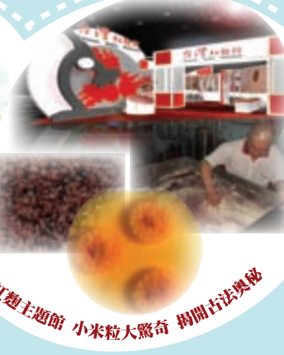
紅麴主題館 小米粒大驚奇 揭開古法奧秘