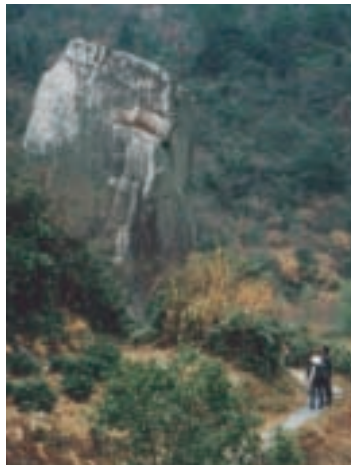
從「嶮石」前的這條石板小路向北，走14里路，就是安徽地界的黃山