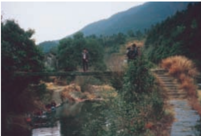
村中青年走在古橋上