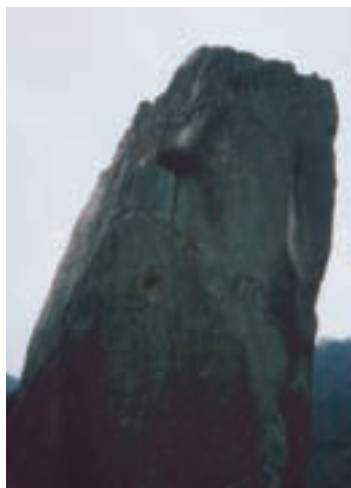
從另一個角度看「嶮石」