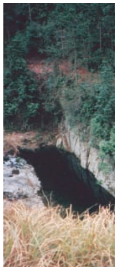
蒸菜用的竹架子就是從這裡沉下去，暗流把它帶到很遠的村莊，再浮起來