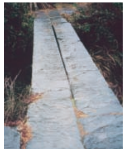
古人切割長達4米的青石，搭建堅固石橋