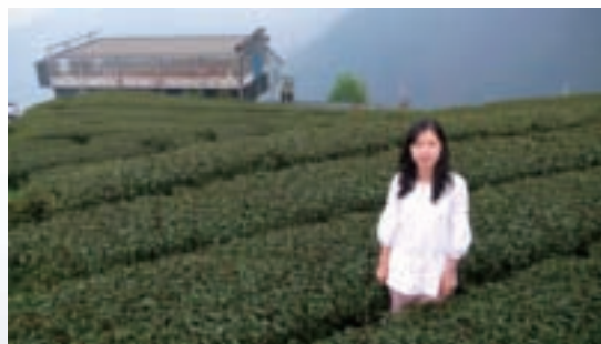
在三棧坪茶園徐若瑄拍攝「御茶園」廣告的場景