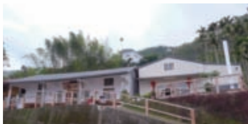
民宿富有濃濃的山居閒情

南 投縣竹山鎮大鞍里的「山林瓦舍」民宿（原太極山莊）創立於民國71年，後因太極峽谷封山而停業；97年全新裝潢再度出發，目前專辦天梯一日遊、二日遊等多元、有趣的套裝行程。