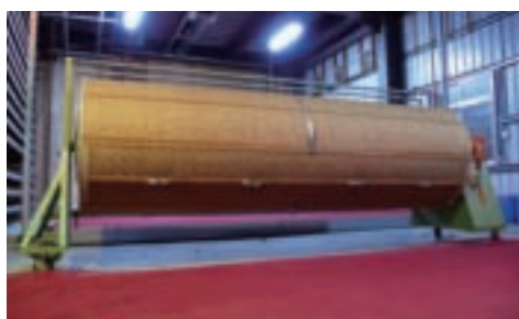
利用滾菁機攪拌，使茶葉能完全發酵