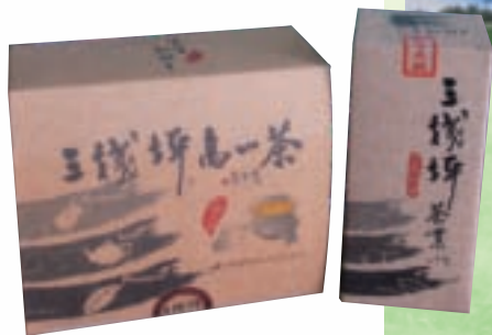
農場建立「三棧坪」 自有品牌