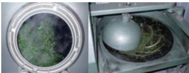
利用高溫將茶葉炒熟「殺菁」