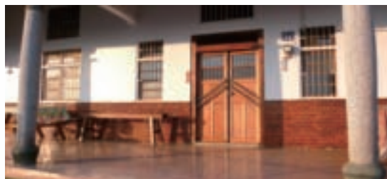
大鞍里「山林瓦舍」民宿