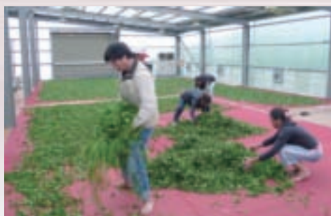
茶葉採收後運回製茶廠，鋪開進行室外萎凋

三棧坪茶園屬於杉林溪茶系，茶區終年雲霧繚繞，氣候涼冷，非常適合茶樹生長，因晝夜溫差極大，茶芽平均生長期長，日照短，茶葉所含苦澀成分較低，而茶胺酸及可溶氮等對甘味有貢獻的成分含量提高，且因土壤有機質含量高，故其葉肉厚、柔軟，果膠質及內涵豐富，製成的成茶外觀勻整、富有油光，茶湯色澤蜜綠，滋味甘醇、滑軟，香氣高雅，喉韻渾厚，乃茶中之極品。