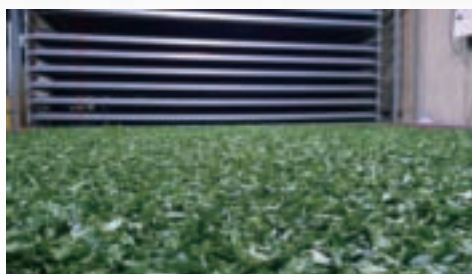
茶菁移至製茶廠內繼續室內萎凋