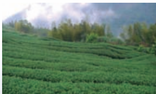
屬於杉林溪茶系的三棧坪茶園