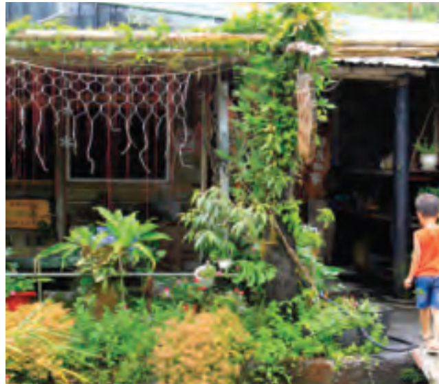
赤柯山的民宿被綠色植物包圍妝點，常令遊客驚喜