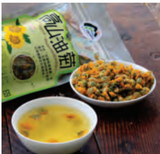
高山油菊不用施藥完全天然，配上枸杞與甜菊是夏季消暑降火好飲品