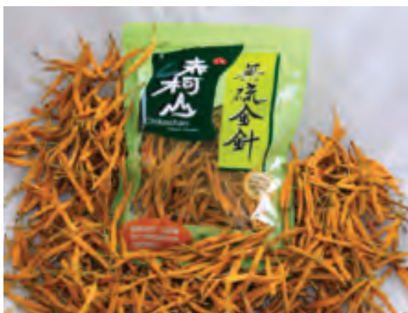
農民生產無硫金針保障消費者健康

早期醫藥不發達的時代，許多人就稱許苦茶油的妙用。即使物資愈來愈進步的現代，縱然有許多更加便利的新產物，仍有很多像苦茶油這種質純、實在的好東西，是不容易被取代，也令人難以忘懷的。赤柯山的苦茶油愈來愈出名，每年10月中旬到12月中旬，正好是金針農閒期，也是農民採收苦茶籽的時候，壓榨出的苦茶油常供不應求，但部分體驗農家仍堅持留到夏季，分享給上