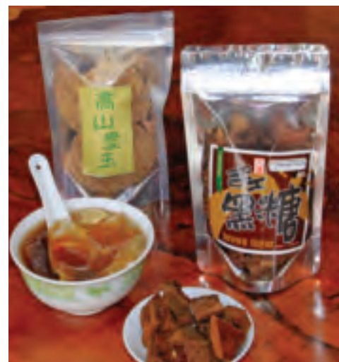
赤柯山愛玉、黑糖都是天然無毒的食物，市面上難買到，體驗農家吃得到