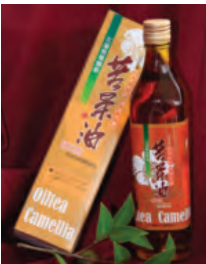
農民用古法榨苦茶油，養生好產品

迎接今年金針季到來，讓赤柯山的美化為永恆，花蓮縣政府農業發展處特別舉辦攝影比賽，並分成專業組和手機組，內容是以赤柯山境內花海、農村、人物等景色為主，具有故事性及活潑感較受歡迎，收件日期到98年10月1日止。因此，