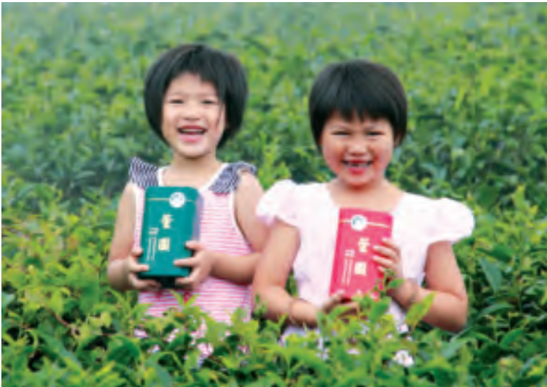
赤柯山無毒農業高山茶清香甘醇又健康