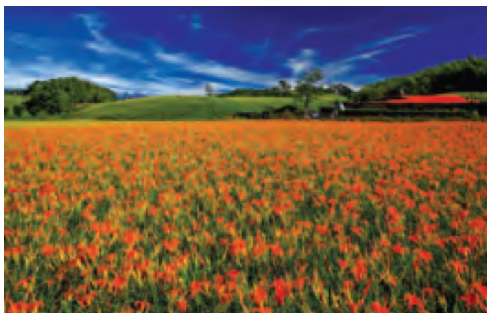
花蓮赤柯山金針花海熱情迎賓，營造幸福的生活天堂