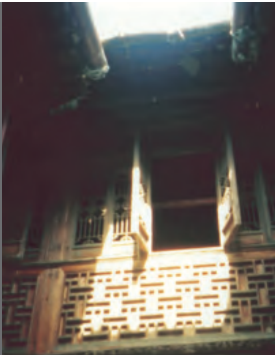
木樓從前任茶葉商人，現在叫做「小姐樓」