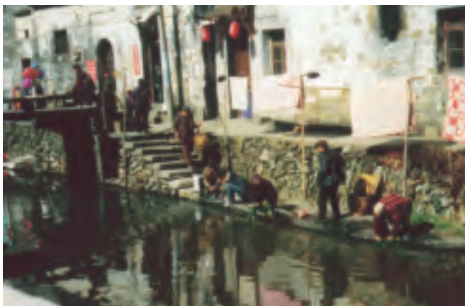
村婦和老人手中的綠色植物叫「魚塘草」