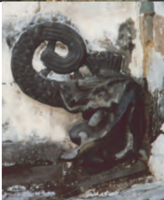
「天官上卿」的鯨魚近景

遊客進了村莊，只顧抬頭看古建築，不太會想到腳踩的青石板小路。村內由兩邊古宅夾成的巷道，全由青石板鋪成。我在以前說過野外的青石小路，野地裡的石板小路走