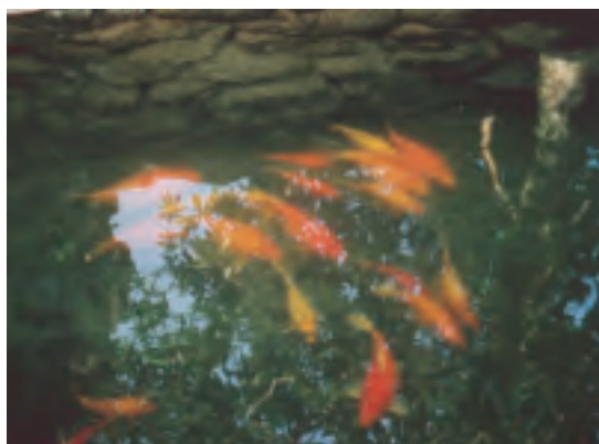
頭小腹圓的「荷包紅鯉魚」