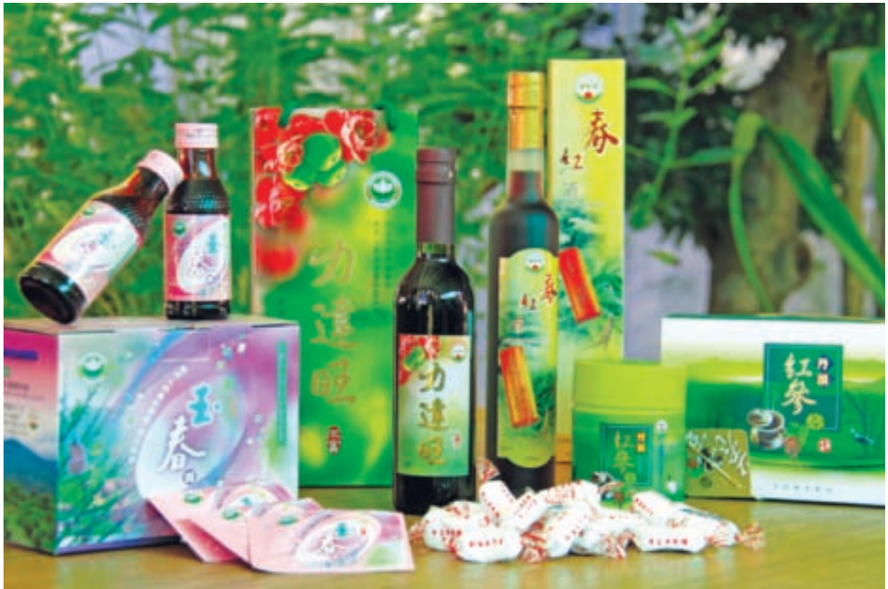
當歸、丹參以生物科技做成各種加工保健產品