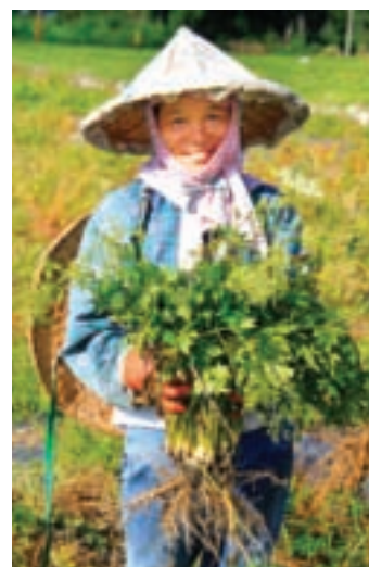
林子花在當歸園打工，感到很幸福