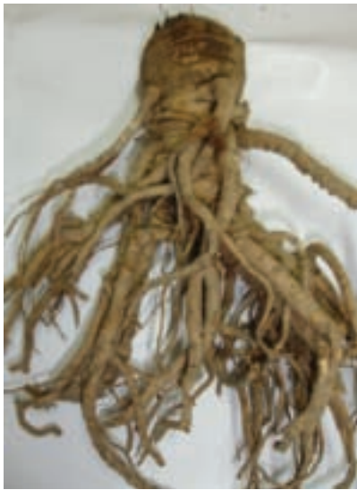
當歸是以根部為主要藥材