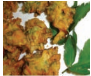
當歸葉和麵粉油炸很可口

農改場還開發丹參多樣化產品，包括了丹參複方保健茶包、複方丹參保健飲品、丹參藥膳調理包等產品，而花蓮縣藥用保健植物