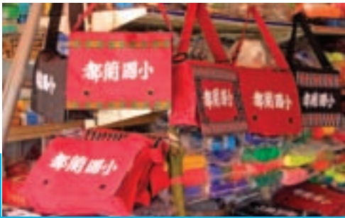
都蘭書包意外成為流行的時尚配備