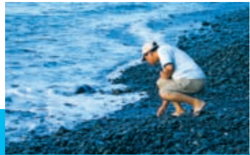
都蘭人稱加母子灣為會唱歌的海岸

走在都蘭的街頭，來往的人車不多，但閒晃的人不少。亭棚下，三五原住民聚在一起，飲小酒，來段即興式的歌謠；新東糖廠附近是藝術家聚集的場所，還有來自美、法、荷、澳等國的外國人士，每人的打扮都各具特色。有的雕刻，有的畫畫，還有做音樂的，但都一個樣的晃來晃去。