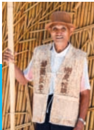
沈太木頭目傳承樹皮衣等製品