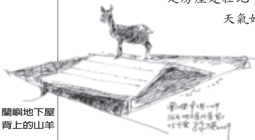
蘭嶼地下屋背上的山羊