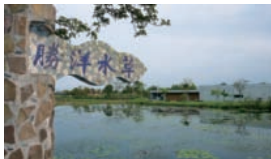
農場成為橫山頭休閒農業區重要景點