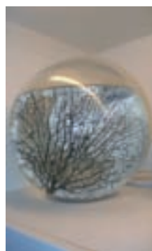
奇特的球形生態瓶