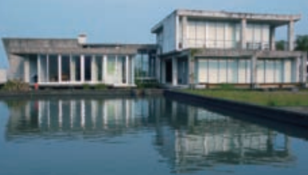
農場內的「宜蘭厝」特色建築