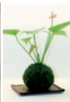
極為討喜的植栽苔玉球