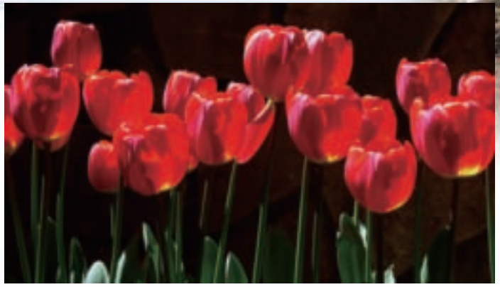
農場培育的鬱金香