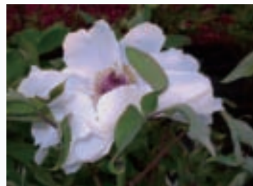
農場首創「落地」培育的牡丹花