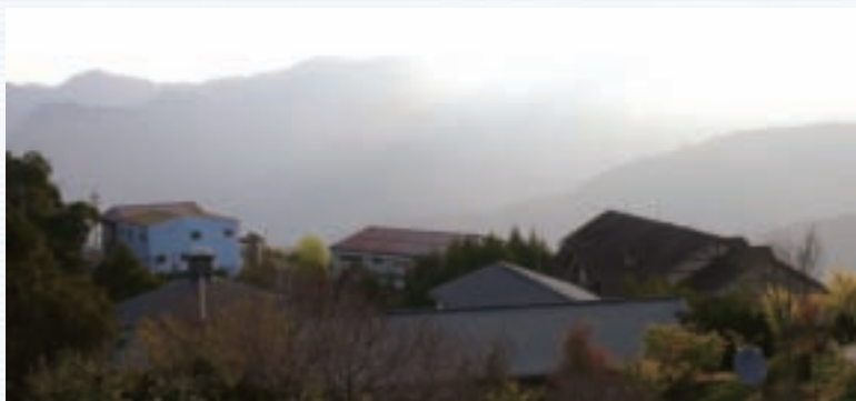
從農場花園俯瞰農場全區

雪霸休閒農場農場四季皆有美艷的花卉，將農場點綴成一片繽紛。尤其是台灣唯一的小藍莓果園，令人為之新奇驚豔，非常受到遊客們的歡迎與喜愛。