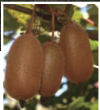
雪霸休閒農場引進栽植的奇異果