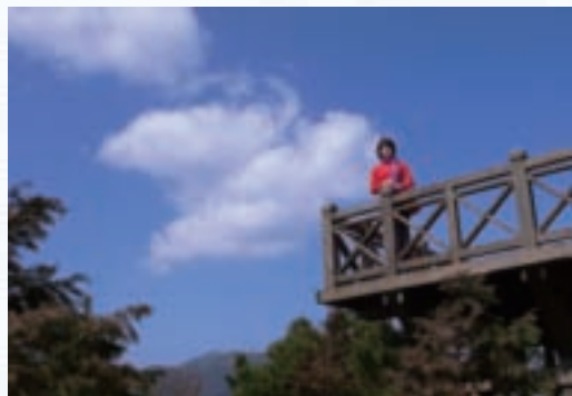
觀霧森林遊憩區觀景台