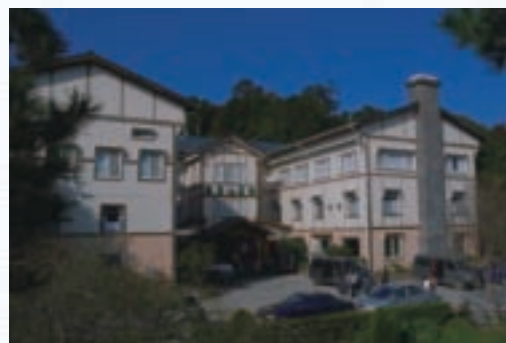
雪霸休閒農場本部

巨木群步道： 從觀霧派出所往西行約1公里，即可抵達巨木群步道的入口，步道全長4公里，部份原本是運送木材的台車路，現在則變成遊客賞景漫步的林間步道，當雲霧瀰漫步道時，仿如置身仙境，全程約需3個小時。沿途的動植物資源相當豐富。步道中，分佈著5株千年紅檜巨木，遊客可駐足欣賞千年巨木的風采。