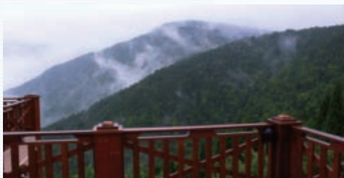
由觀景台眺望野馬瞰山樹海