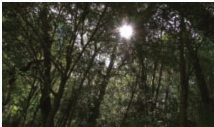
陽光穿透原始森林

農場達人精心設計最在地的玩法，總帶給遊客驚奇與喜悅。迷霧、雲海、晚霞、日出、森林、巨木、星空、聖稜線，雪霸八景絕不能錯過，並深入「野馬瞰山步道」、「雲霧步道」，一路上，柳杉林、落葉林、國寶檜木等，陽光灑落在層層林道間，光與影的遊戲在此上演，霧氣靄靄，林樹紗紗，彷彿走進魔法森林。沿途可見明日葉、棟幕華鳳仙花、黃花鳳仙花、馬告、冬青油樹、野生蘭花、二葉