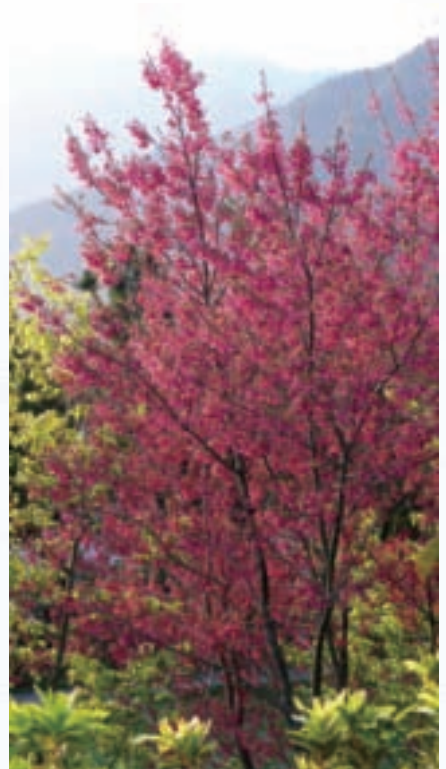
迎著朝陽怒放的山櫻花

農場得天獨厚的地理環境，栽培出不同凡響的水果食材。在主廚創意搭配下，都成為桌上養生美饌，不論是藍莓果律蝦球、蓮霧牛柳、奇異果醉雞、百香果雞肉盅等水果珍饈，樣樣挑逗視覺與味蕾。此外，主廚精心製作的精緻西式水果套餐，則令人回味無窮。用新鮮香甜的水果調