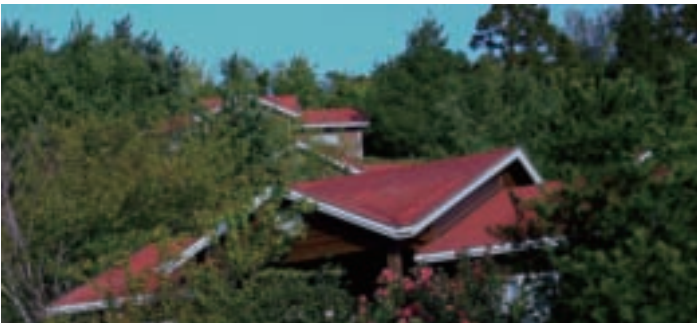
童話夢境般的歐式木屋區