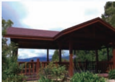
農場花園設有觀景亭