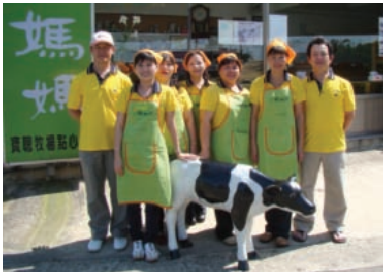
寶聰牧場點心坊的成員與店門口的迎賓乳牛合影