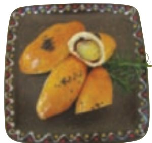
點心坊創意點心—黃金薯