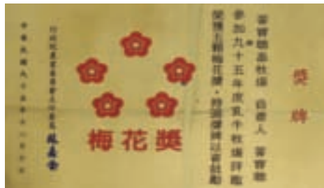
30年歷史的寶聰牧場，生產的鮮乳獲酪農評鑑最高的五顆星梅花獎