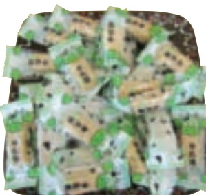
點心坊乳製品—牛軋糖