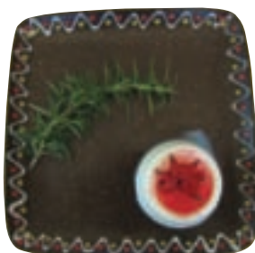
點心坊乳製品點心—奶凍