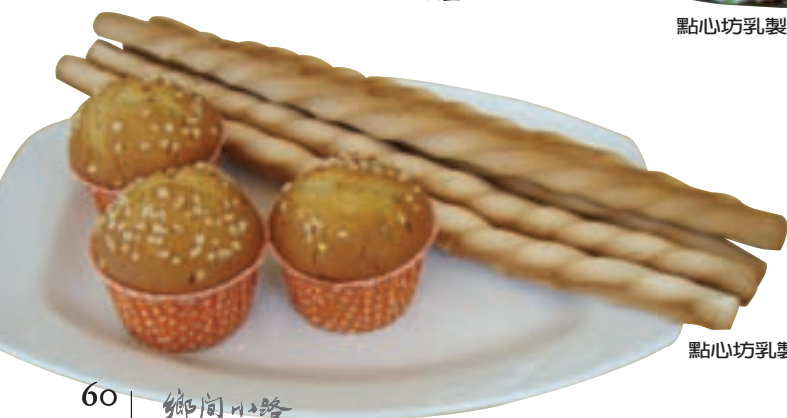
點心坊乳製品—牛奶棒與杯子蛋糕