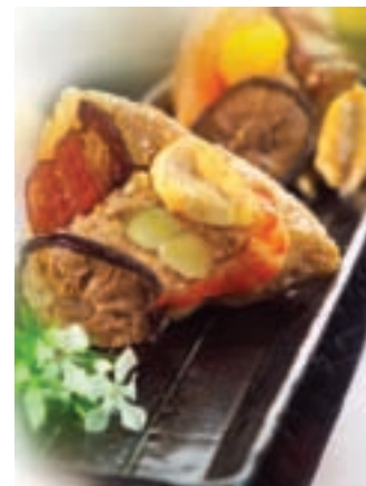
鮭魚粽採上等配料

低溫時較無不稔的現象，成品除了可烹煮白米飯以外，用來做壽司、飯糰或替代糯米製作油飯、粽子、米糕，比較容易消化，還容易調理入味，是很難得的壽司絕佳材料，相信很快就能風靡眾生。