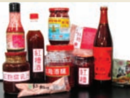
圖1 市售常見之傳統紅麴食品

(3) 紅糟豆腐乳：中國之紅糟豆腐乳曾被琉球王室權貴視為是病患及產婦之最佳補品，傳統是將紅麴菌及黃麴菌以1：3之比例混合進行發酵熟成，