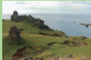
綠島唯一有白沙的海灘