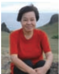
筆者騎在牛頭山的牛背上