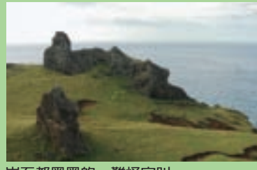
岩石都黑黑的，難怪它叫「火燒島」