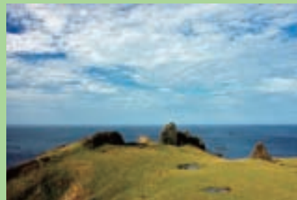
想不想來這裡拍個海誓山盟的婚紗照？