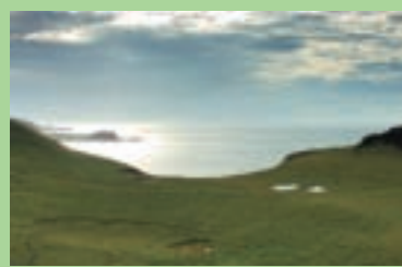
牛羊吃過的草比剪草機剪的還要整齊