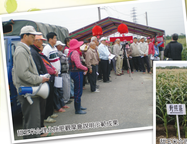
甜玉米合理化施肥觀摩會說明示範成果