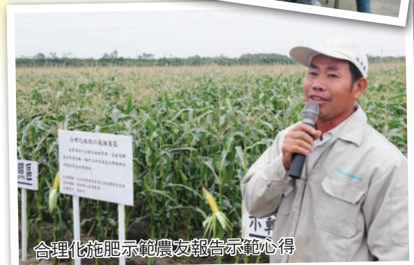
合理施肥示範農友報告示範心得