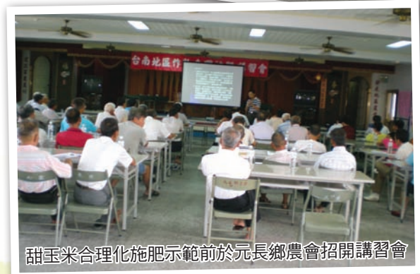
甜玉米合理化施肥示範前於元長鄉農會召開講習會

土壤反應 (pH) 低於 5.5, 宜再參考土壤中氧化鈣及氧化鎂含量, 若為土壤酸化問題, 推薦施用一般石灰資材或苦土石灰 1 - 2 公噸/公頃以改良之。