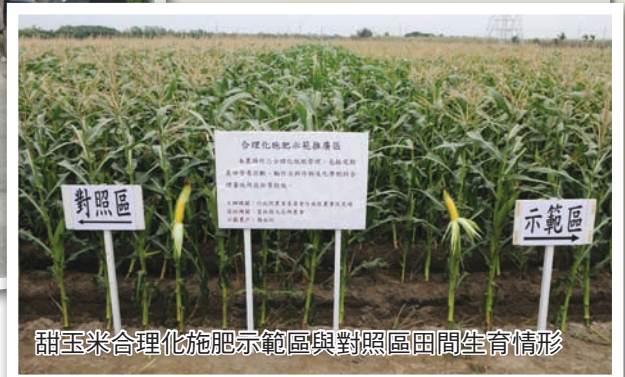
甜玉米合理化施肥示範區與對照區田間生育情形

示範區為 383 公克及 2.01%，較農民慣行施肥區之 410 公克及 2.49%，各減少 7% 及 19%，顯示採用合理化施肥可提高甜玉米品質。