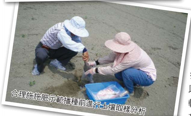
合理施肥示範播種前進行土壤取樣分析