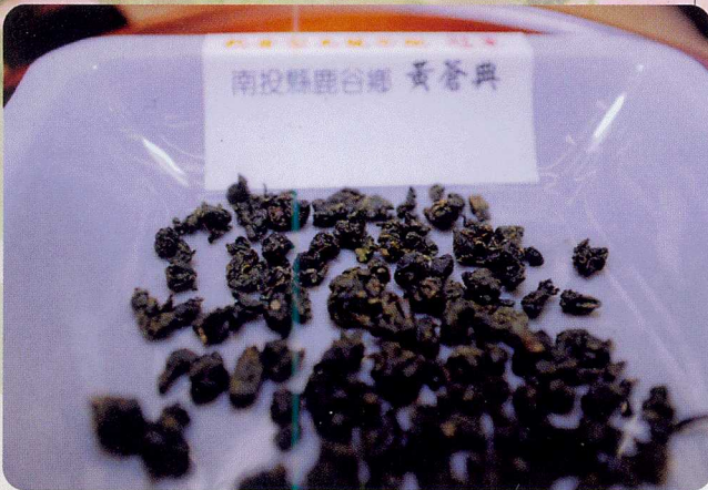
▲熟香型烏龍茶組冠軍茶外觀