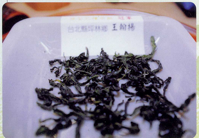
▲條型包種茶組冠軍茶外觀