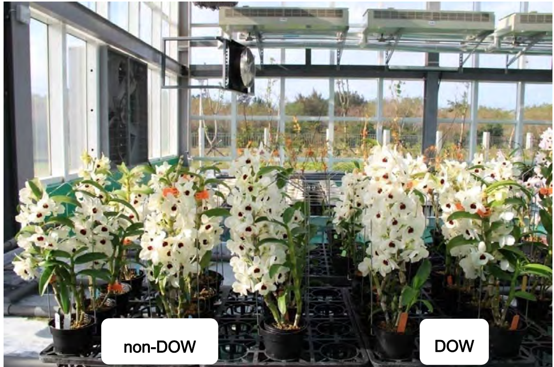
圖 14. Den. Tian Mu Diamond No. 3 於試驗 110 天後之開花情形，右方三列為深層海水催花植株。