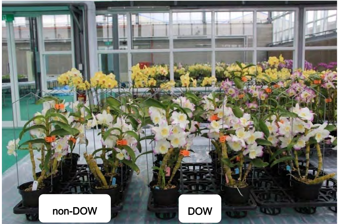
圖 4. Den.Lai's New Sailor 於試驗 150 天後之開花情形，右方三列為深層海水催花植株。