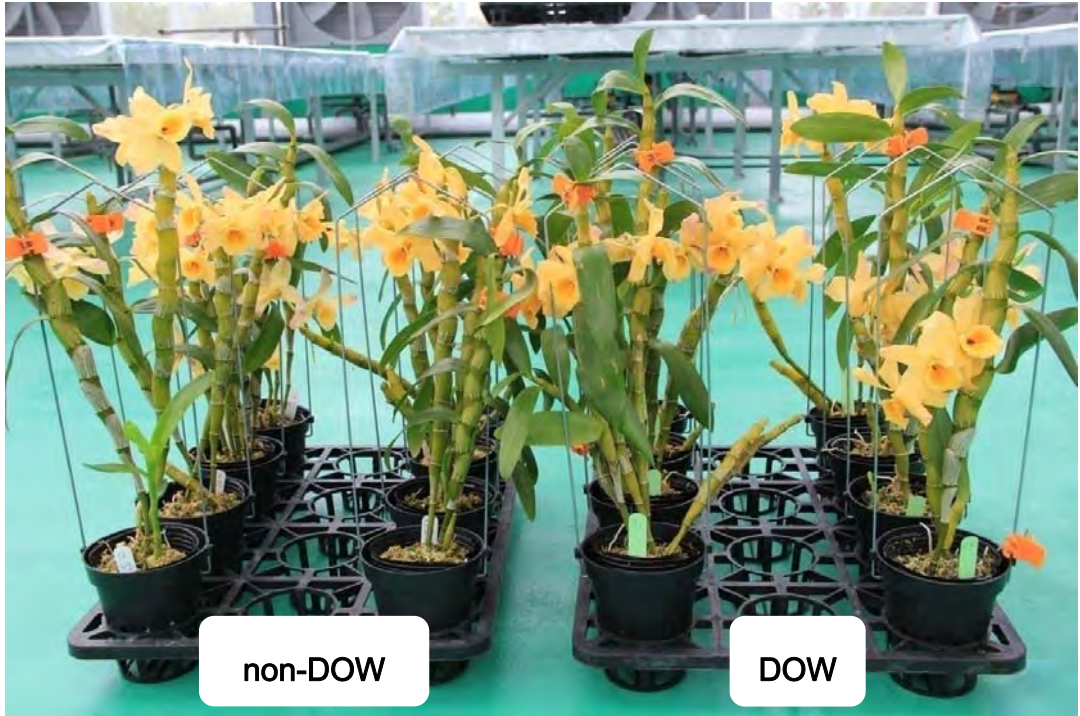
圖 10. Den. Hambuhren Gold Lady 於試驗 150 天後之開花情形，右方兩列為深層海水催花植株。