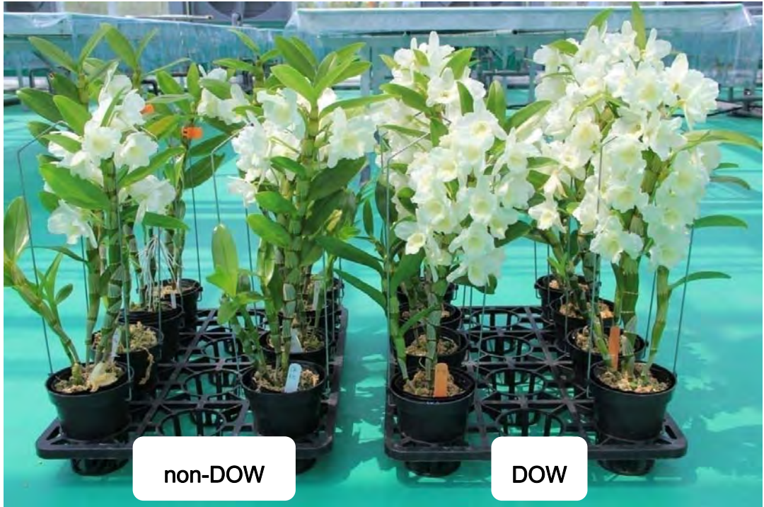
圖 12. Den. Tian Mu No. 1 於試驗 150 天後之開花情形，右方兩列為深層海水催花植株。