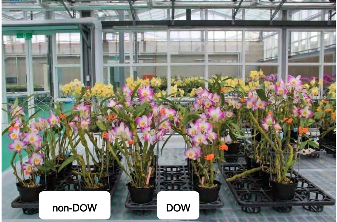
圖 5. Den. Lai's New Christmas 於試驗 150 天後之開花情形，右方三列為深層海水催花植株。