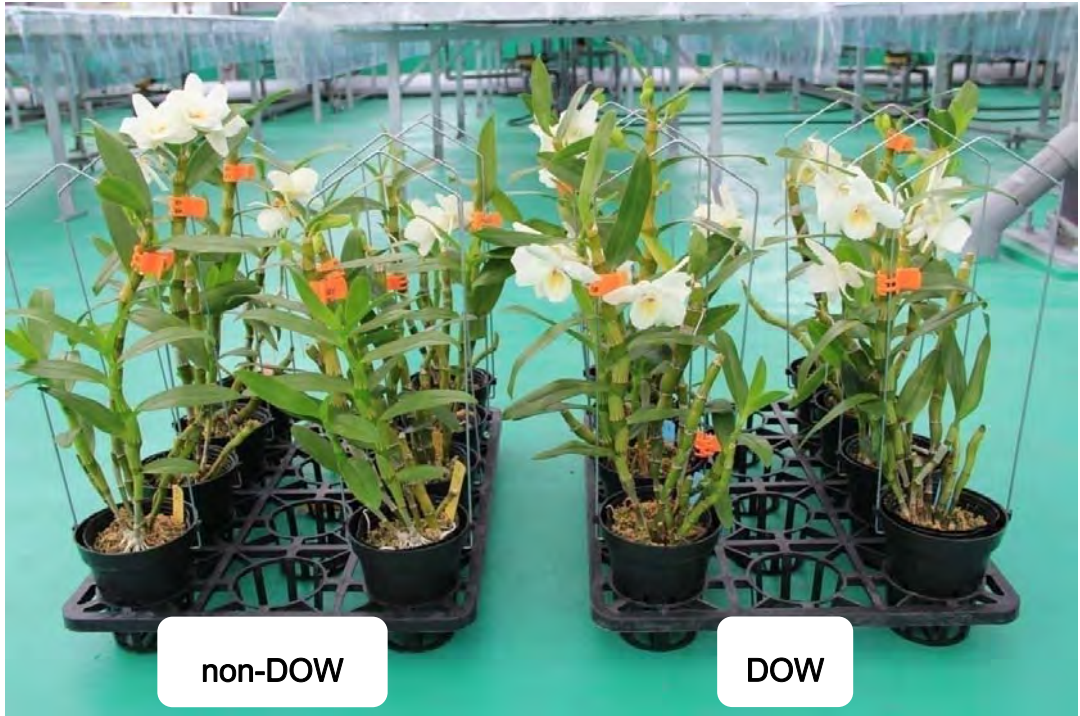
圖 8. Den. Sailor Boy 'Popye' 於試驗 150 天後之開花情形，右方兩列為深層海水催花植株。