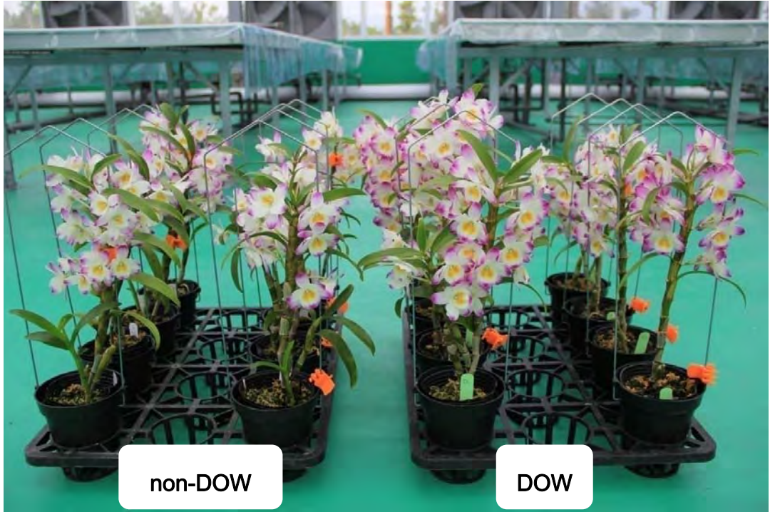
圖 6. Den. Lai's Lovely Queen 於試驗 150 天後之開花情形，右方兩列為深層海水催花植株。