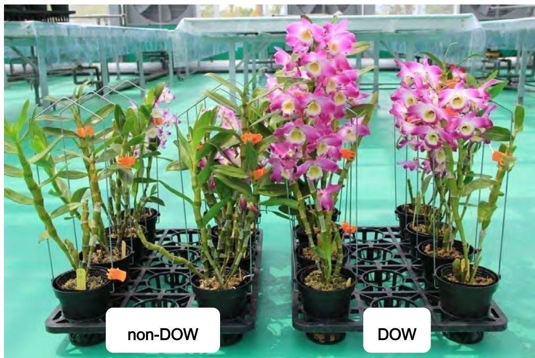
圖 11. Den. Hamana Lake X Den. Lai's Hunter Stage 於試驗 150 天後之開花情形，右方兩列為深層海水催花植株。