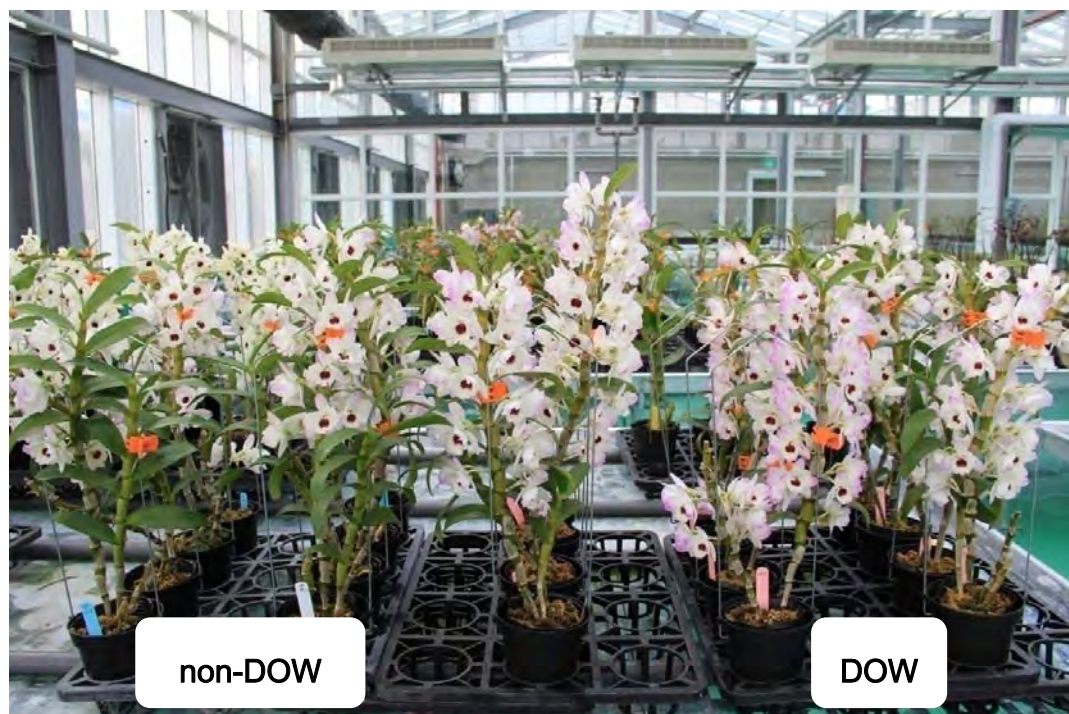
圖 13. Den. Tian Mu Diamond No. 2 於試驗 110 天後之開花情形，右方三列為深層海水催花植株。