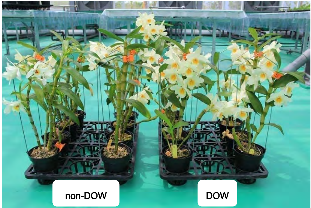
圖 3. Den. Arco Pearl Queen 於試驗 150 天後之開花情形，右方兩列為深層海水催花植株。