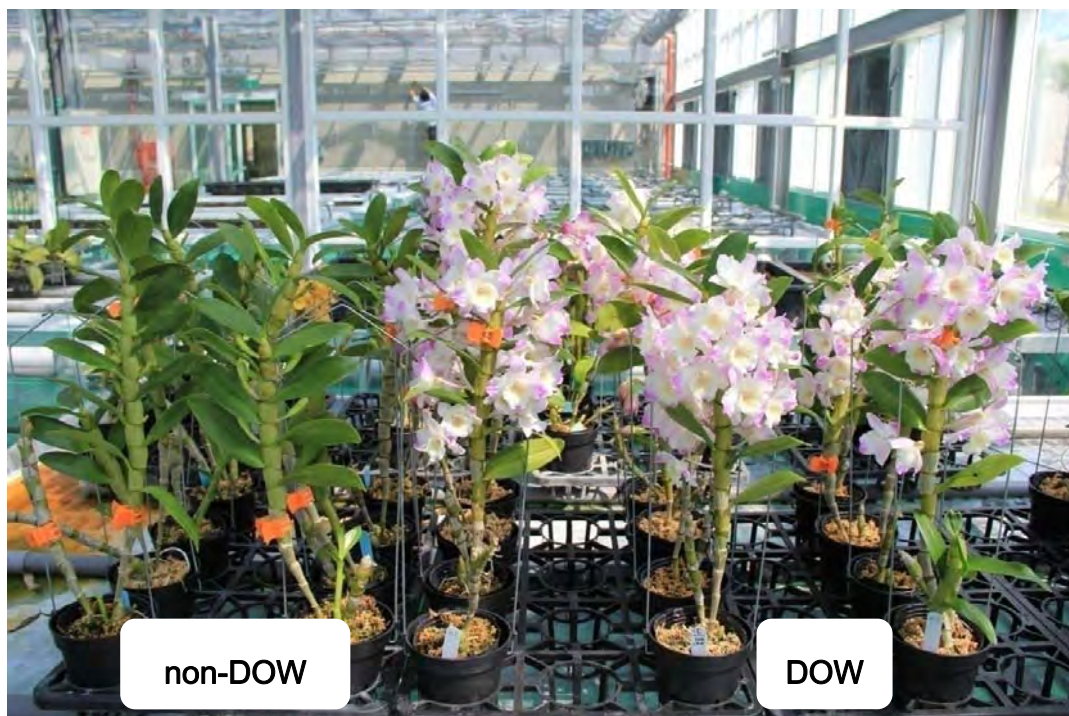
圖 15. Den. Tian Mu No. 4 於試驗 110 天後之開花情形，右方三列為深層海水催花植株。