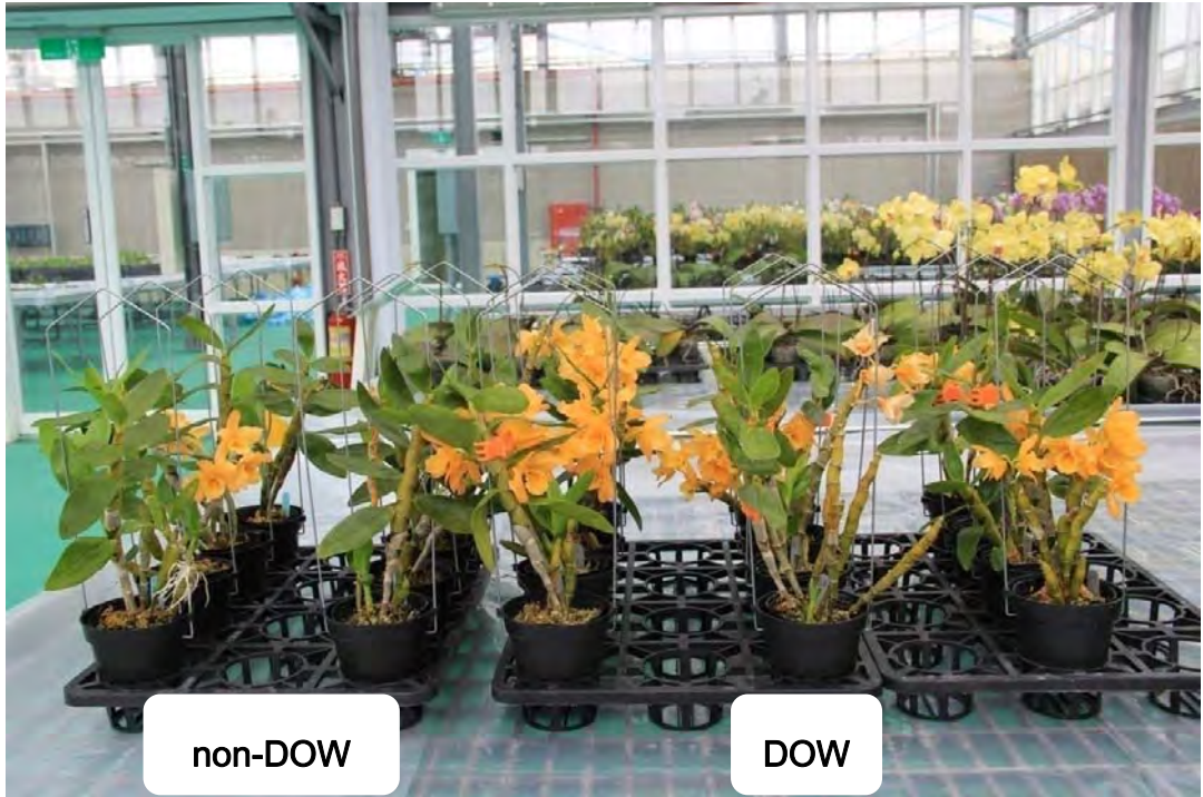
圖 7. Den. Mildas 'Princess' 於試驗 150 天後之開花情形，右方三列為深層海水催花植株。