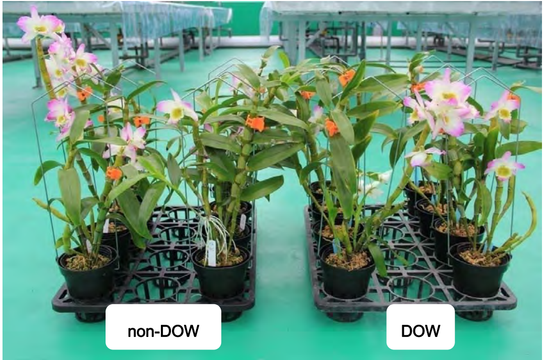
圖 9. Den. Mild Yumi 'Kokusai' 於試驗 150 天後之開花情形，右方兩列為深層海水催花植株。