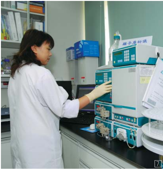
7 離子層析儀。8 液相層析質譜儀。