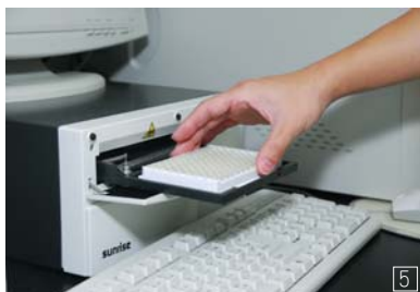
1 由蘇忠楨組長（右1）領軍的台灣動物科技研究所應用動物組。2 液相層析儀檢驗。3 位於竹南生技園區的動科所，以專業嚴謹的態度為家禽家畜的檢驗把關，扮演政府、業界及消費者的橋樑。4 液相層析儀。5 酵素免疫分析儀。6 待檢驗檢體。