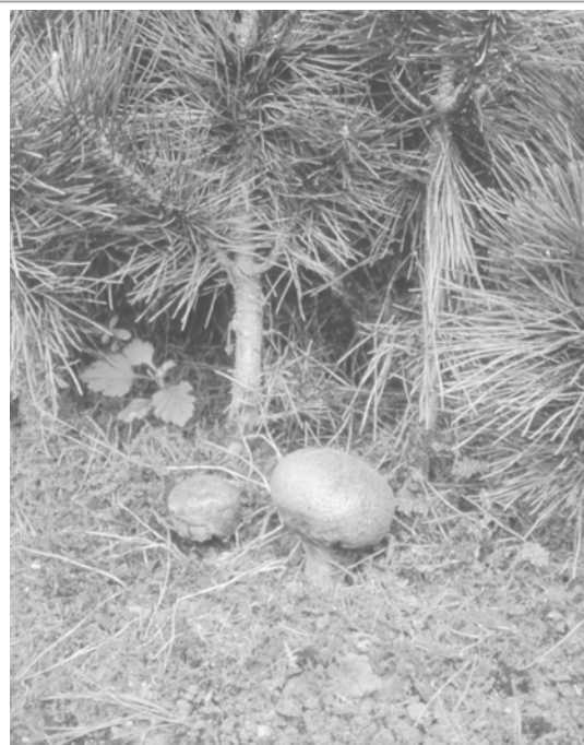
苗圃中黑松苗床長出的彩色豆馬勃菌根菌子實體

彩色豆馬勃( Pisolithus tinctorius (Pers.) Coker & Couch.) (簡稱 P. t. ) 屬擔子菌類腹菌綱真菌，能與大多數松科與殼斗科植物形成外生菌根(ectomycorrhize)，在培育松樹的苗圃中偶而可以發現 P. t. 子實體的出現，外生菌根菌可以經由子實體做成存培養的菌絲，進行大量繁殖作為菌根接種，同樣以無菌發芽的