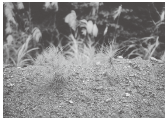
未接種 P. t. 的琉球松真葉漸漸黃化，最後全株枯死

琉球松幼苗進行接種 P. t. 試驗，將這些接種與未接種小苗栽植於煤礦棄土地，未接種菌根之小苗全株針葉開始黃化，漸漸枯萎，約2個月時間後全數枯死，接種 P. t. 幼苗成活率高達95%，生長旺盛，針葉翠綠，四年高生長可達2~3公尺，生長量不遜於肥沃的生育地。