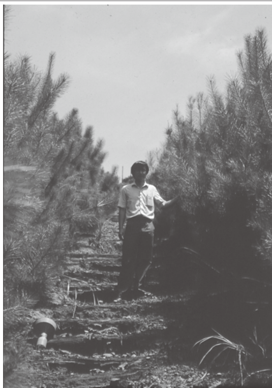
四年生接種 P. t. 的琉球松在煤礦棄土地生長旺盛針葉翠綠