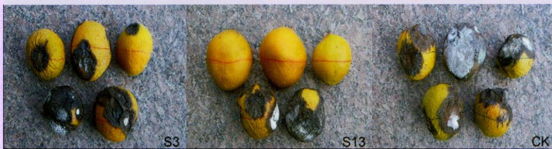
枯草桿菌菌株防治檸檬炭疽病的效果 (第 19 天)

枯草桿菌不只可增加農產品的安全性，有利於農產品的外銷，更可創造農民更高的收入，同時兼顧國民食的健康，並減少化學農藥對環境及農民造成的衝擊及危害。近年來，農委