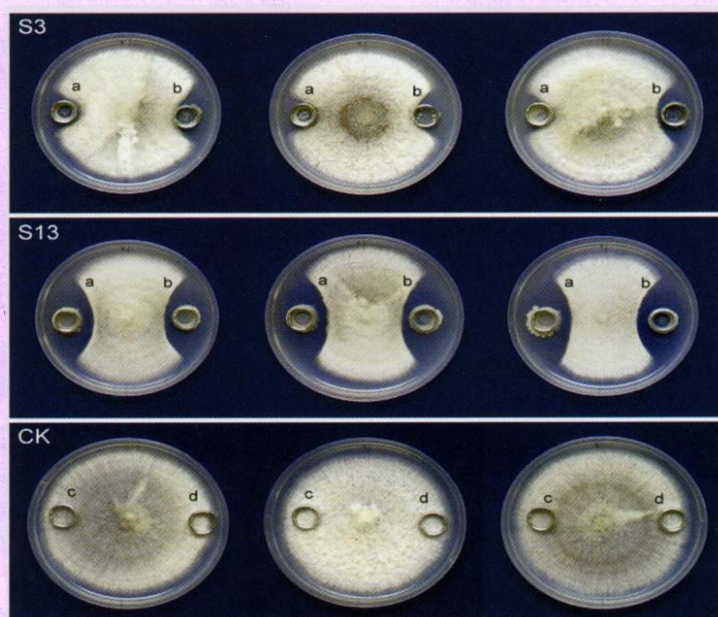
枯草桿菌菌株抑制檬果（芒果）炭疽菌絲生長的情形

生物農藥，指可作為植物保護用之天然物質，包括動物、植物、微生物及其所衍生之產品。依施作靶標害物為對象，生物農藥與傳統農藥皆可分為殺蟲劑、殺菌劑以及除草劑 3 類；若依來源別區分，可分為生化農藥、微生物農藥與植物生產之農藥等 3 類。由於生物農藥沒有危害人、畜或生態之虞，是現代全球農藥發展與農業生技的重要研究方向之一。