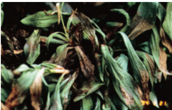
圖 17. 洋桔梗白絹病