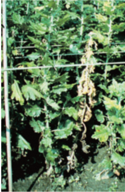
圖 5. 菊花萎凋病

a. 注重排水或改變灌溉方式，可避免根系因浸水造成之傷害，而增強植株之抵抗力，可減少病害之發生及傳播。