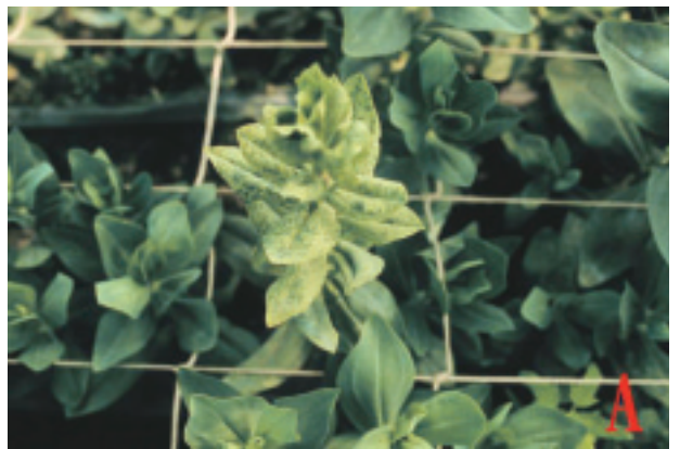
圖 20. 胡瓜嵌紋病毒為害洋桔梗之病徵