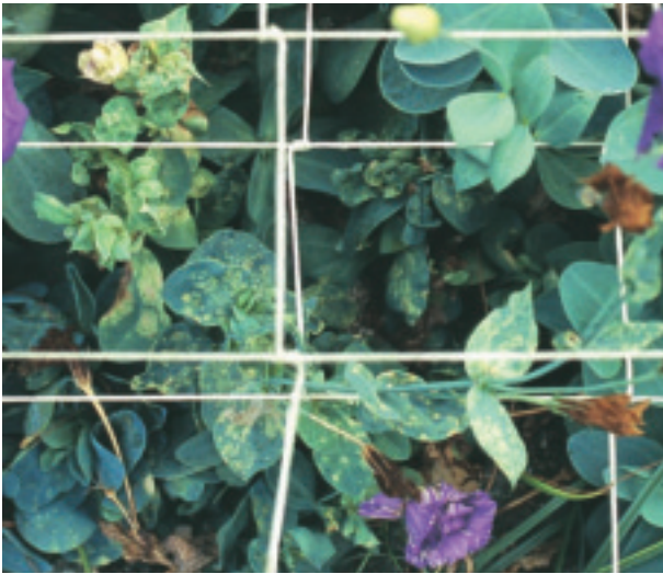
圖 21. 洋桔梗壞疽病毒病徵

LNV 可經由真菌 ( Olpidium spp.) 或土壤傳播。國內之發生案例可能與進口種苗有關。排水不良之田區發病會較嚴重。