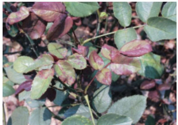
圖 9. 玫瑰露菌病