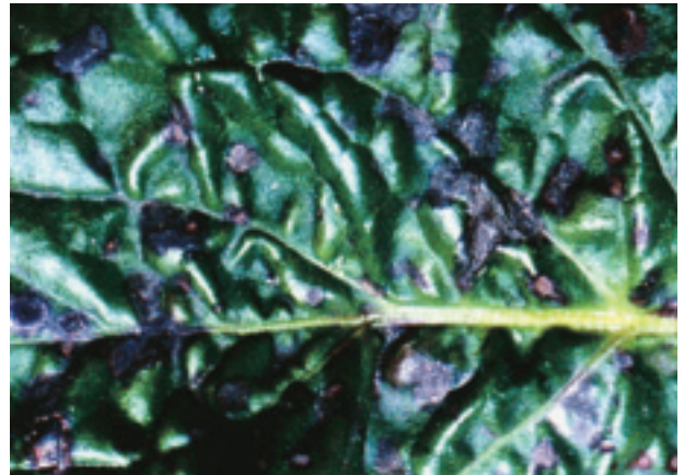
圖 12. 非洲菊紫斑病