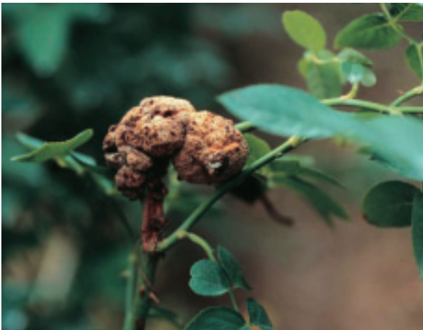
圖 10. 玫瑰癌腫病