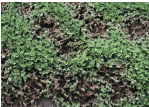
圖 1. 菊花莖腐病