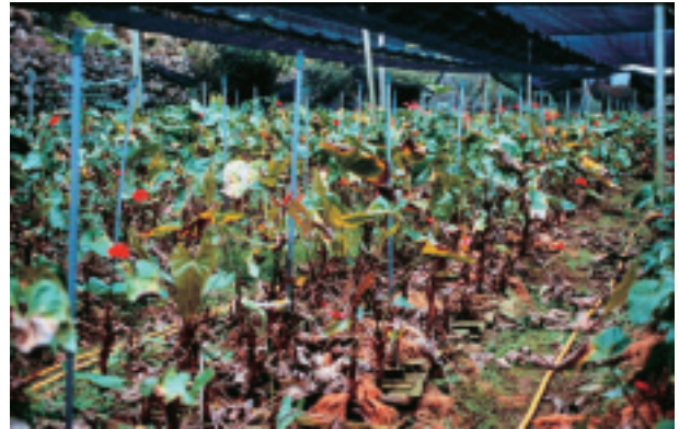
圖 22. 火鶴花細菌性葉枯病