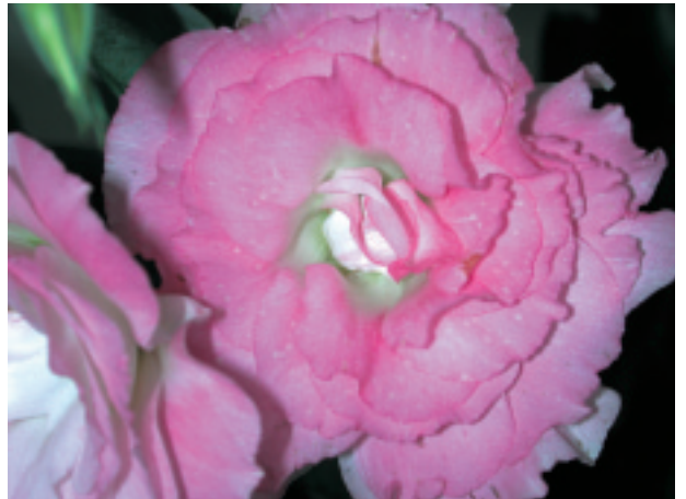
圖 19. 洋桔梗花腐病

田間自然感染 LNV 之洋桔梗，發病初期於上位葉出現許多淡黃色圓斑，並逐漸轉化成壞疽斑點，偶也會出現輪圈狀的斑點；有時鄰近許多斑點融合成斑塊，甚至導致被害葉萎凋或葉頂枯死。類似的病徵也在發病嚴重之植株的花梗和花莖出現。罹病植株開花受到抑制，花呈畸形，或花瓣出現褪色狀條紋。