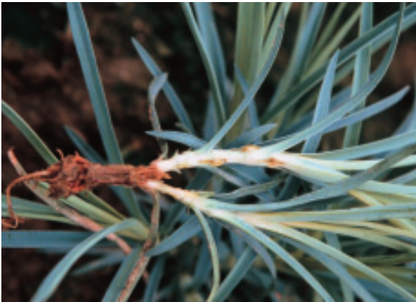
圖 14. 康乃馨細菌性萎凋病

由下位葉開始萎凋，逐漸往上蔓延，有時植株呈半邊萎凋或側枝萎凋，嚴重時整株枯萎死亡；病株莖部橫切面，可見到維管束褐變現象，將病枝插在清水中，很容易使清水變混濁，後期根部腐爛。細菌性萎凋病在冬季甚少發生，而入夏後便逐漸增加，且平地比高冷地區嚴重。病原細菌亦可為害滿天星及洋桔梗，產生相同之病徵。