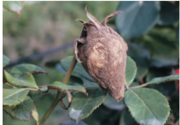
圖 8. 玫瑰灰黴病