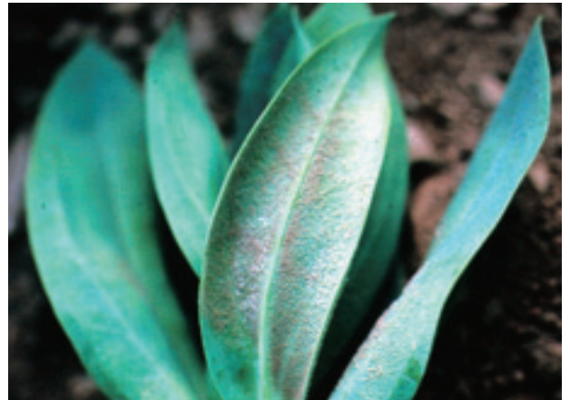
圖 15. 洋桔梗露菌病

或種苗帶菌可能為最初之感染源。本病主要發生於春、秋兩季，溫度及濕度均適合時，病勢進展極為迅速。