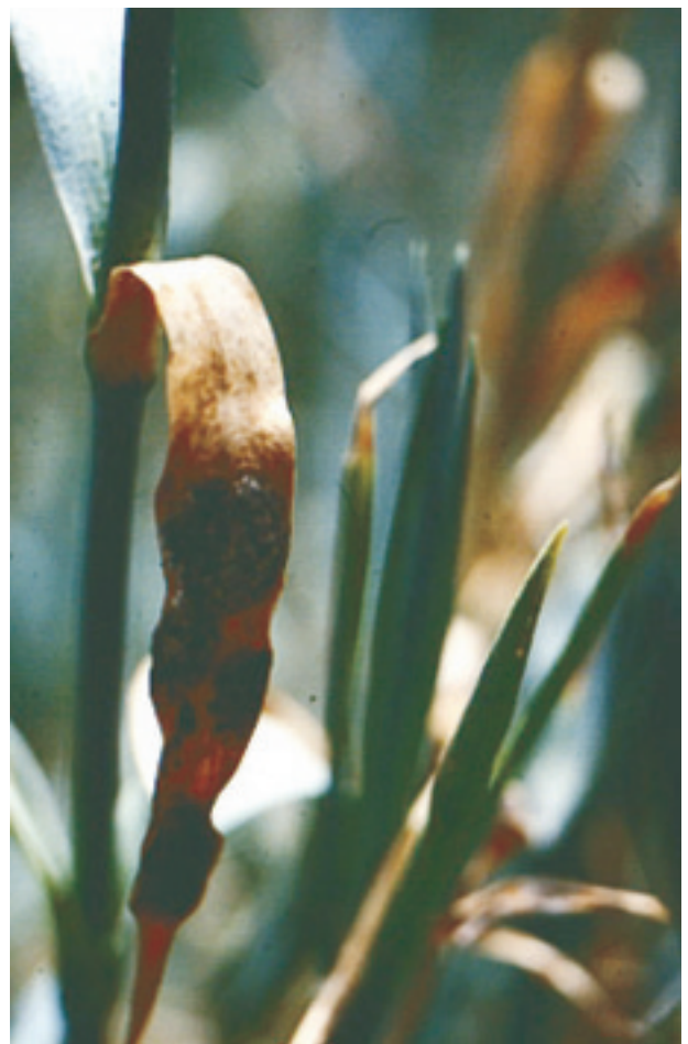
圖 13. 康乃馨葉斑病