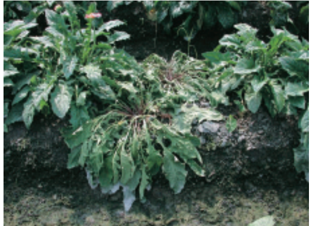
圖 11. 非洲菊疫病