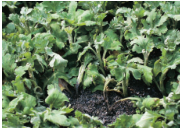
圖 2. 菊花軟腐病