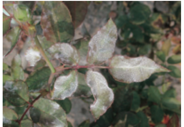
圖 6. 玫瑰白粉病