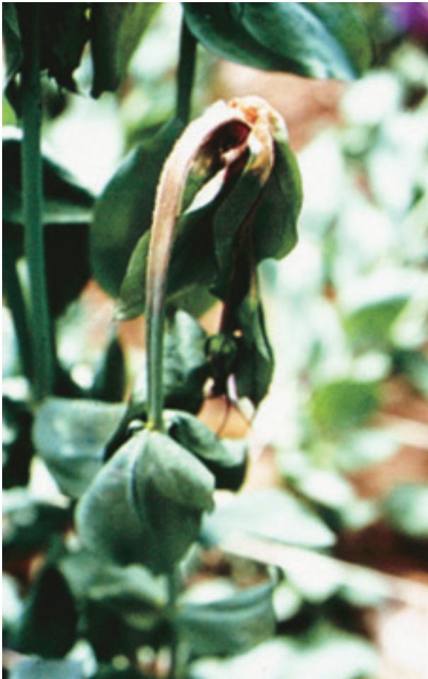
圖 16. 洋桔梗灰黴病