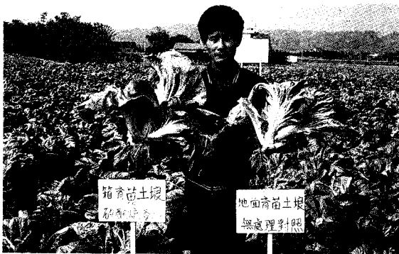
▲箱育苗添加3%矽酸礬渣定植後生長較對照組顯著改善，確保產量。