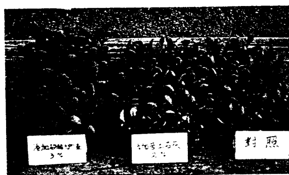
▲無病原育苗土添加3%矽酸爐渣，顯著改善芥菜苗之生長。

(1) 育苗土壤調配：用表土30公分以下未耕過之深層清潔之砂壤土或紅壤土加河砂，1比2，並加3~5%有機肥，然後再添加3%矽酸爐渣或2%碳酸鈣，即100公斤清潔砂壤土加3~5公斤有機肥加3公斤矽酸爐渣（或2公斤碳酸鈣）充分混合均勻，並灑水保持濕潤堆積一週以上，即可裝入育苗