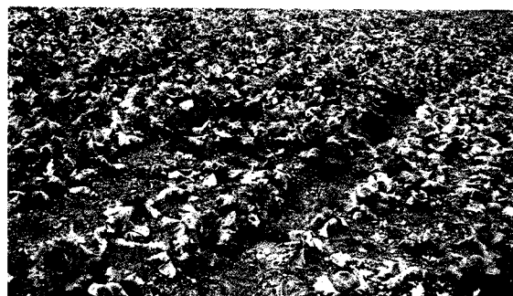
▲對照區發病嚴重，植株矮小、凋萎，下位葉黃化。

之外，地上部則生長緩慢或停滯，最後枯萎，毫無收成。本田期發生根瘤如在主根形成，對地上部生長影響亦大，如僅在支根形成，地上部與健株不易分辨，即對產量影響較不明顯。