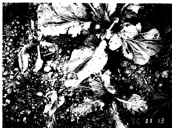
▲健康株與發病株生長差異明顯，病株主根結瘤，根系喪失。