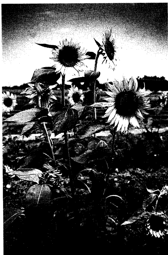
▲利用摘心增加切花枝數，可增加農民收益。

向日葵是用途極廣的作物，從藥用、油用、食用到觀賞切花用及景觀綠肥用，甚至於現今流行的休閒花茶飲用之各品種，均有其重要的經濟價值，這是向日葵受人青睞之處，其中栽培觀賞切花用向日葵品種，農民應注意培育強健幼苗，及配合摘心與否調整其適當的栽植密度，適時搭設栽培網架，並適當施肥與灌溉，如此應可生產高品質之切花用向日葵。 ■