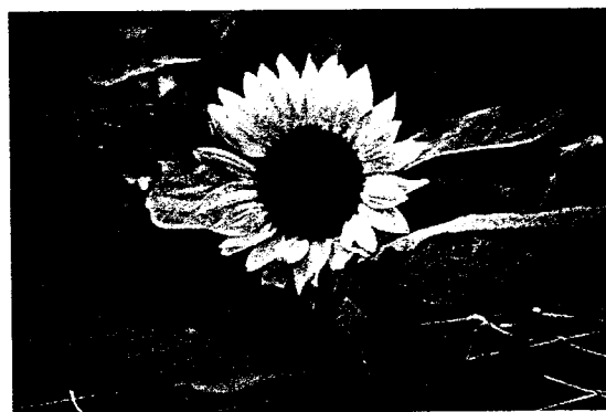
▲搭設栽培網架支撐向日葵，可效降低颱風造成的倒伏，穩定切花採收。

其售價高，且栽培期間遇強風時，花莖易與網線磨擦受傷而產生褐斑，影響其外觀及切花品質。搭設網架時期約在定植後2週，株高約30公分時進行，其方式可採用一層網架，網子高度隨向日葵生長調整至90公分；或兩層栽培網，第一層網高30~50公分，第二層網於向日葵植株高約60~70公分時搭設，網高約90公分。搭設或機動調高栽培網時需儘量避免網線與植株碰觸磨擦，以免受傷。本場於90、91年度試驗結果顯示，於颱風旺盛期搭設網架可有效減少向日葵植株40~80%的倒伏率，增加五至七成切花率，極具穩定切花生產效果。