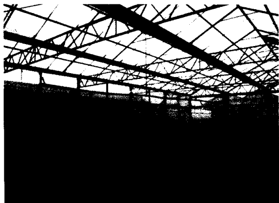
圖1：設施內噴灌設備

短，故較少引發病害；其缺點可能是無法噴灑的很均勻且塑膠管懸吊在空中容易變形，而從播種後即行噴灌措施，容易滋生雜草；如蔬菜生育中後期葉片開展後，繼續採用噴灌方式來供給蔬菜水分，則因此時蔬菜葉片平軟與地面平行，噴灌的水珠容易被葉片截流阻擋，滯留葉片，落到土壤根部的的水分不足，以致發生葉片太濕而土壤中植物根部卻缺水的現象；作物吸收水分的機制是根部而不是葉片，葉片滯留水分過久，百害無一利，除容易遭到太陽曬傷外，亦容易因附著空氣中之病原菌孢