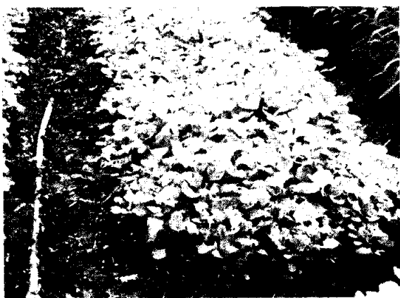
圖3：設施內改良式滴灌

此法係將畦面，做成兩端略為隆起之凹字型狀，中間開淺溝，穴盤苗移植或蔬菜種子條播後，將塑膠滴管軟帶置於淺溝中，出水細孔朝上，尾端封閉，前端接灌溉塑膠管（圖4），播種初期可利用開關將噴水寬度調至可涵蓋畦面，生育中後期調至略高於土面進行淹灌即可，如此可避免蔬菜葉面噴濕，減少病害發生，畦溝因無積水，雜草亦少，且直接灌溉植株亦達到