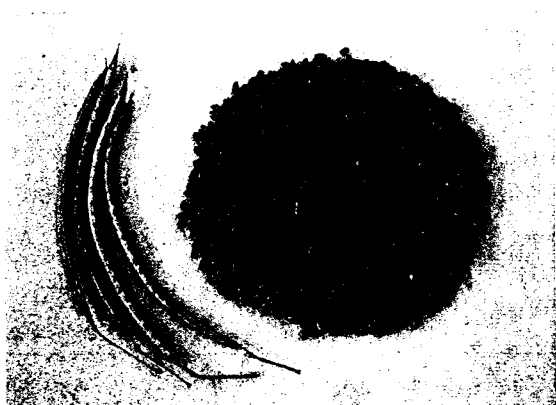
圖二：可作飲料用的決明子