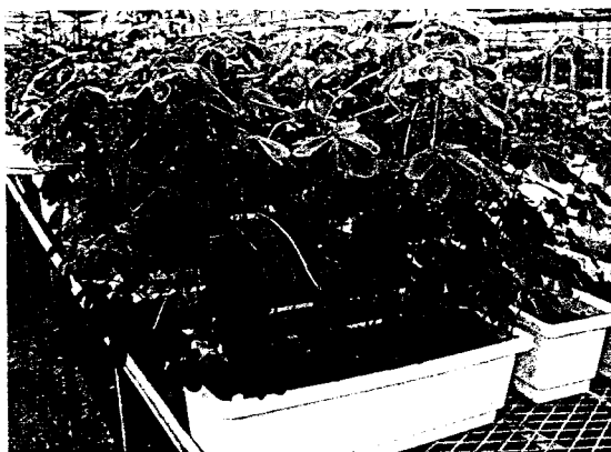
圖五：可供綠美化的決明盆栽

力，於是進行栽培及研發決明的各種料理和飲品，提供民眾多一種的選擇。茲將其利用方式敘述如下