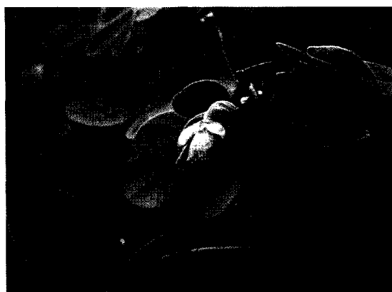
圖一：黃色的決明花

決明屬於豆科 (Leguminosae) 決明屬，學名 Cassia tora L.。爲一年生草本植物，俗名有草決明、馬蹄決明、馬蹄子、馬蹄草、槐豆、江南豆、羊角豆、圓草決、草決及大號土山豆等，藥材名爲決明子。決明通常自生於荒野草地，台灣全島各地常可見成群繁生，植株高約30~100