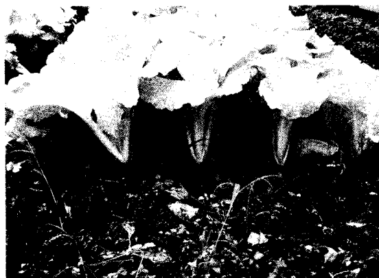
▲由於小白菜育苗移植之生育快速，田間雜草變成弱勢競爭者，因此採收期之品質佳且整齊。

30plants/3.2m 2 ，但是，當栽培密度高於76plants/3.2m 2 時，其產量亦呈現下降的情形，例如，密度144plants/3.2m 2 處理，其產量比60plants/3.2m 2 (行株距20×25cm)與76plants/3.2m 2 低。雖然，栽培密度提高可以增加單位面積的產量，但是，單株葉球重量則隨著栽培密度的增加而減輕，密度過高不但使其葉球變小，較嚴重之情形為葉球畸形，外觀品質變劣。本試驗在過度密植區密度144plants/3.2m 2 ，尚未達最大產量時期，即因生育空間不足而影響其葉球發育，導致葉球畸形或不結球等異常現象。此外，在疏植區單位面積栽培株數少，雖然單株葉球重量變大，但是由於植株數量太少反而使其總產量降低。因此，必須適當選擇行株距，以獲得最大之產量