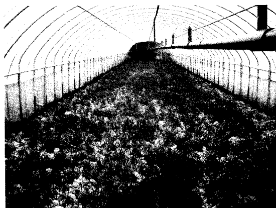
▲小白菜直播栽培之生育空間不一致，生育不整齊，雜草生育快速，影響產量及品質。

及最高之品質。對半結球高莖大湖659品種而言，60plants/3.2m 2 (行株距20×25cm)是較為理想之栽培密度。