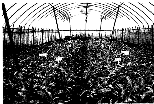
圖 1. 種植前 48 小時淹水處理、黃色黏板大量誘殺，並配合藥劑防治，建立綜合防治技術，可以有效解決有害生物防治。

Fig. 1. An integrated insect pest control by removing the debris of previous crop, setting yellow sticky cards, and 48 hrs submerging treatment before sowing was then established for control of soil pest.