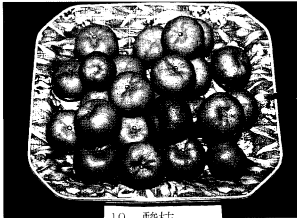
酸桔果實為製造桔醬原料

目前酸桔採收後主要製作為酸桔醬，民間加工廠之製作流程為材料→清洗→割裂→去籽→果皮與果肉分離→果皮→水煮→漂水一日→混合果肉同煮→加入鹽、糖、辣椒等調味→裝瓶→封罐→出售。