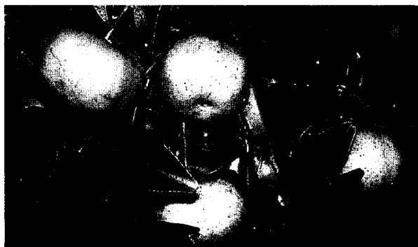
酸桔為其他柑桔類重要的砧木

前尚未有為酸桔訂定之施肥標準，暫訂以一般柑桔產量為依具據之施肥法來進行肥培管理，所施用之肥料量如下表：