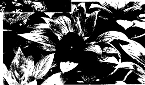
定植後不久即可開始開花，毋需長時間栽培。