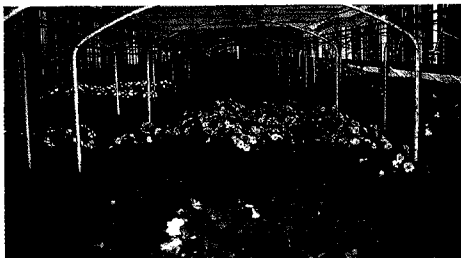
桃改場五峰工作站（海拔1000公尺）夏季日均溫25℃，夜均溫20℃，新幾內亞鳳仙可生長良好，開花不斷。

新幾內亞鳳仙是一種快速生長的作物，在適當環境下，只要經過8~10週的栽培即可出貨，在歐美、日本、澳大利亞每年均有大量消費利用在居家或庭園佈置之用，但是在本省由於消費者認識不多以致市場狹小，目前只有在本場轄區內少數農戶栽培，缺乏足夠的資訊，品質因而不盡理想。事實上，新幾內亞鳳仙花色繁多又能開花不斷，具有草花的效果又能在室內栽培觀賞，以此為賣點加以推廣必能使消費增加，期待本文能提供栽培業者參考以提高品質，符合市場需求。◆