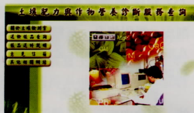
本場土壤肥力與作物營養診斷服務查詢首頁

本場已將土壤肥力分析資料納入電子化管理，並結合網路，提供便捷迅速的作物營養診斷技術諮詢及報告線上查詢服務，同時減少報告郵寄的不便及所需時間，達到即時服務的目標。查詢方式可進入桃園區農業改良場網站 ( http://www.coa.gov.tw/external/tydais/ )，再點選「土壤診斷服務」進入查詢系統。本系統可查詢送檢樣本處理狀態，尚未分析完成的樣品會顯示「檢驗中」字樣，檢驗完成的樣本可進一步查詢分析數據與參考建議，並可使用「列印」功能直接列印分析報告。