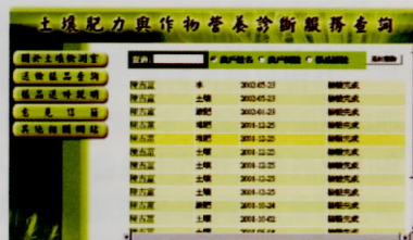
輸入農戶姓名查詢後，列出該農戶所送各個樣品檢驗分析的狀態。