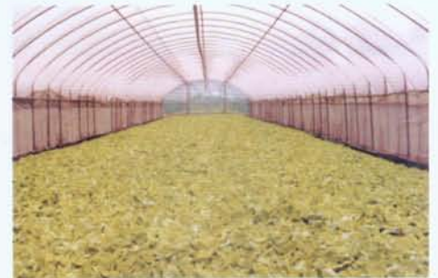
搭建塑膠布(網)簡易設施，進行防雨栽培