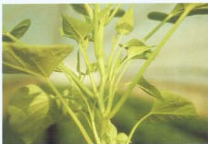
葉菜甘藷桃園二號之再生力強、生育快、分枝多

本品種除了適宜露天栽培外，更適合設施栽培，比種植其他蔬菜容易管理，也適宜作宿根栽培，種植一次可以連續採收兩年再予更新，同時採收期長，整年均可採收，供應市場所需；春夏作7~15天可採收一次，秋冬作每20~30天採收一次，一年可採收10~13次，年產量每分地約2,000~3,500公斤，其半直立型植株適合機械採收，採收時從先端嫩梢15公分割下，此部位幼嫩均能食用，無苦澀及腥味，炒煮後不易褐化，適口性佳。農友可免費向本場索取種苗試種。