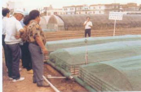
畦面用塑膠(網)布覆蓋，以降低豪雨沖刷土壤與蔬菜