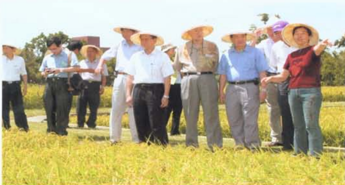
水稻新品種桃園三號田間審查的情形