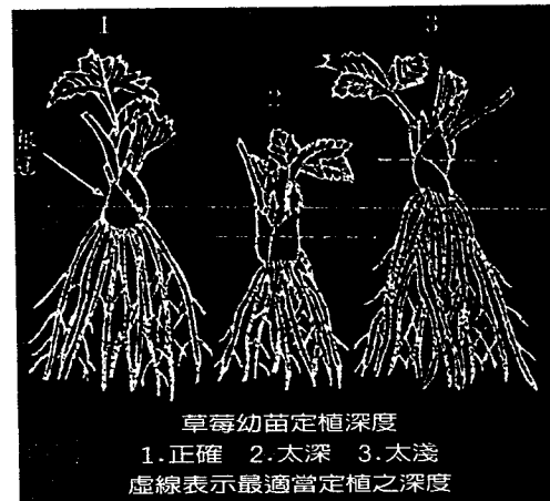
圖3. 草莓幼苗定植深度

根據作物施肥手冊，草莓三要素推薦量（公斤／公頃）如下，但若施用有機質肥料時，則可酌量減少化學肥料之使用量。