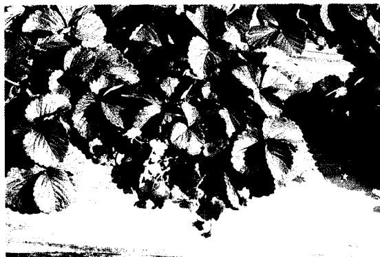
圖1. 桃園1號植株與果實形態

本品種係自日本引進之「豐香」品種選育而來，於79年2月27日命名通過（圖1）。生長勢旺盛，株型稍呈披狀，葉數中等，葉色濃綠，葉質硬，9月中、下旬開始花芽分化，10月下旬開始開花，早生品種，果數較少屬果重型，果實短圓錐形、碩大、鮮紅色而富光澤，肉質多汁，糖度高，果皮及果肉硬，耐貯運，早期扇型果及大果比率高，早期產量與總產量高；惟其缺點為株型披狀，葉柄及花梗短，葉陰下果實著色不良，採收不易，且病蟲害防治困難，為改進此缺點，以激勃素處理將可促使花梗及葉柄伸長，而達改善果實品質及提高工作效率。