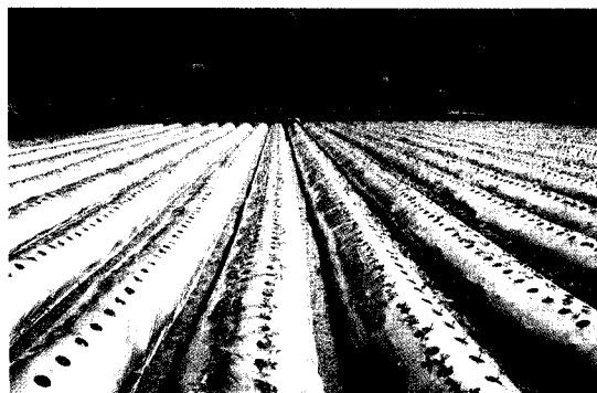
圖4. 草莓穴植管苗種植