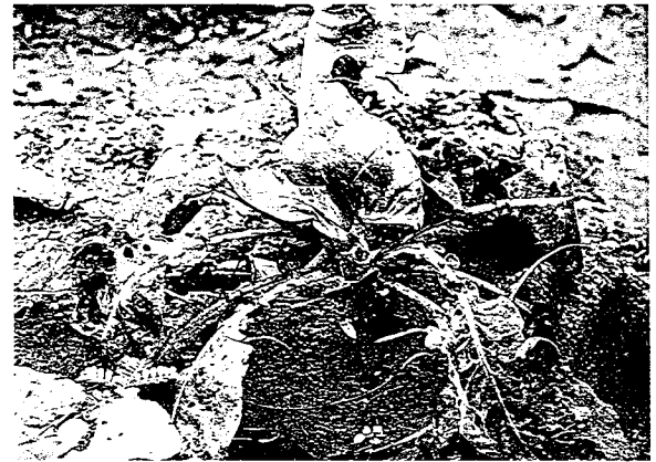
▲花椰菜受銀葉粉蝨危害嚴重時，植株畸形矮化及不開花抽苔。