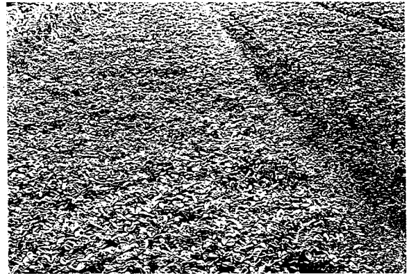
▲密閉通風不良的花生、甘藷田，提供銀葉粉蝨很好棲息場所及食物。

4、繁殖能力大，平均一隻雌蟲產卵120粒，世代短。銀葉粉蝨防治困難原因： (1) 蟲體太小，為害時農民不易察覺，容易疏忽早期防治，一旦發現葉片黃化煤污時，此時已失防治價值。 (2) 繁殖能力強，藥劑選汰下易造成抗藥性。 (3) 棲習於陰涼通風不良之葉背、葉與葉重疊或心葉處，藥劑噴灑時不易到達或接觸致使藥效減低，防治不易。此次以藥劑緊急防治銀葉粉蝨只能治標，無法有效控制此害蟲蔓延及為害，所以今後防治惟有加強田間管理、田間衛生、清除感染源、選用清潔健康苗、實施藥劑防治並配合黃色黏板誘殺才能達到治本之防治效果，即進行綜合防治才能生產無病蟲害、無農藥殘留安全優良之花椰菜。