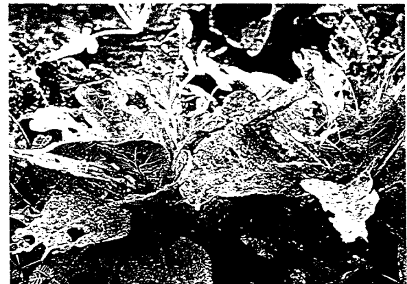
▲甘藍菜受銀葉粉蝨危害嚴重時，植株畸形矮化及不結球。