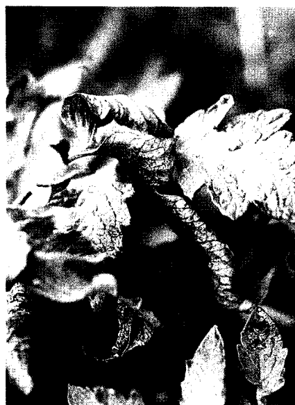
▲番茄受銀葉粉蝨危害嚴重時，葉片捲曲褐化萎凋，使植株生長不良。

於10月11日及18日分別以2.8%第滅寧乳劑及2.8%畢芬寧乳劑稀釋1000倍，實施區段共同防治，另設施藥配合黃色黏板誘殺處理區及對照不施藥區，調查銀葉粉蝨防治效果。結果顯示單純以藥劑實施防治效果不理想，以施藥配合黃色黏板誘殺處理之防治率最好，第一次施藥後七天防治率達99.1%。而對若蟲防治比較處理間差異顯著，以施藥配合黃色黏板對若蟲防治率最好達80%以上。從黃色黏板誘殺銀葉粉蝨成蟲數量比較，施藥處理區成蟲被誘殺數顯著降低，施藥後21天被誘殺數降為559.2隻，而對照不施藥區21天後被誘殺數高達4501.7隻為施藥區8倍。花椰菜實施緊急防治銀葉粉蝨之效益評估，以施藥配合黃色黏板誘殺處理之防治效果最