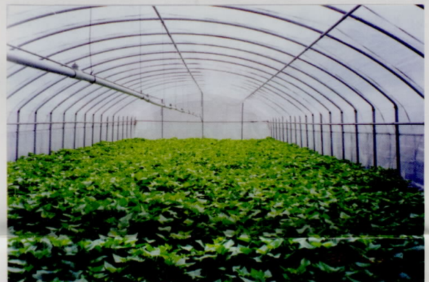
桃園二號葉菜甘藷品質優良