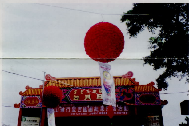
「喜從降」彩球內有大彩