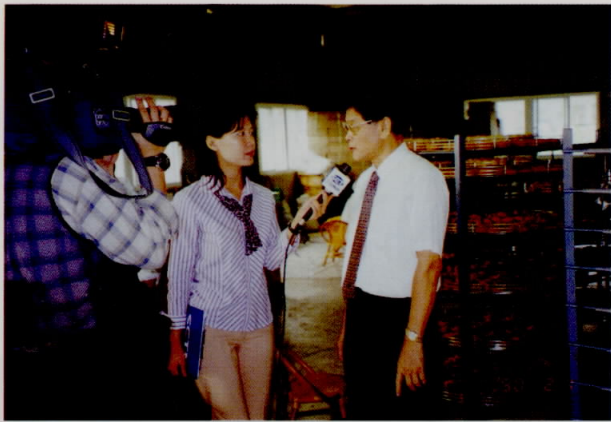
新聞媒體在柿餅加工廠訪問