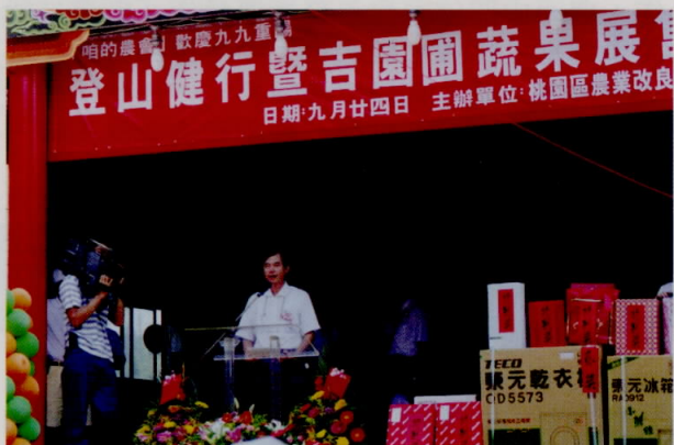
黃副場長在大會致詞

為鼓勵民眾參與，本次大會主辦單位精心設計了「喜從天降」和摸彩活動等一系列趣性節目，更有電視機、自行車等數十件高級彩品。整個活動在一片歡欣、熱烈的氣氛中落幕。