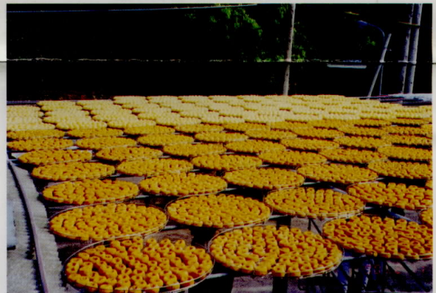
傳統的日晒乾燥法

本場又研發多種新式的柿產品及食譜，如柿冰、柿捲、水柿沙拉、水柿天婦羅、柿餅麻糬、柿餅燉雞、柿飲料、柿蒂飲料。這些產品使柿的消費多樣化，利用價值提高。