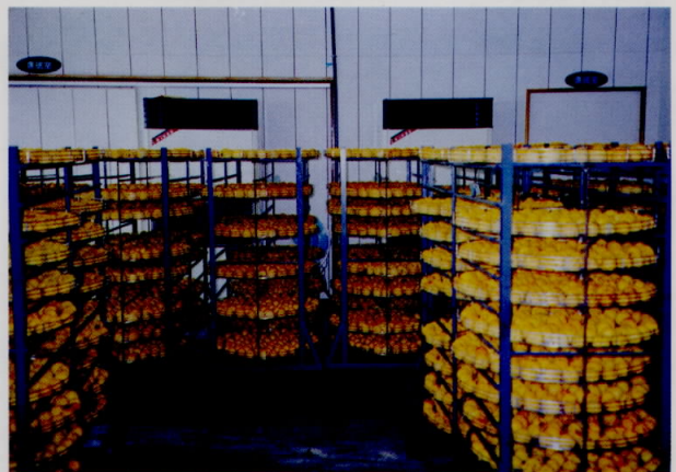
除濕乾燥法在室內完成