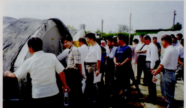
葉菜甘藷新品系栽培觀摩會參觀設施栽培情形

損害，恢復再生能力也很強。本品種種植一次可採收兩年或三年，然後更新。設施內或室外均可栽培。春夏季每7~15天採收一次，秋冬作20~30天採收一次；每年可採收10~13次。又因為其植株屬於半直立型，所以適合機械採收，可節省人工成本。