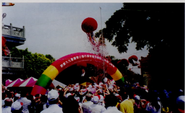
接彩之道，各有妙招