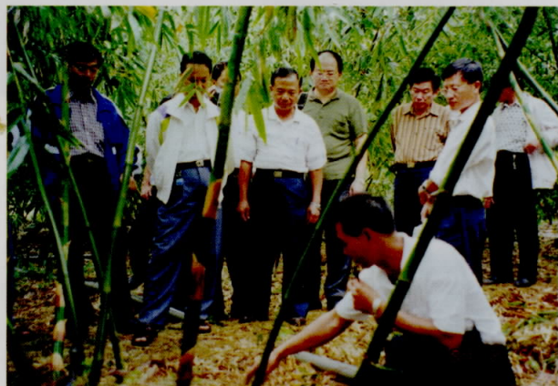
土撥鼠在綠竹筍園挖隧道