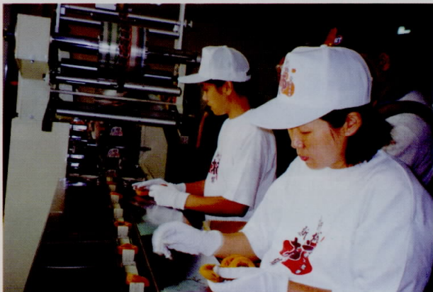
新埔農會的市餅包裝作業