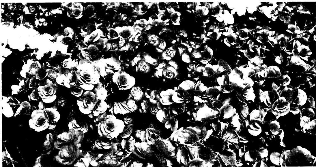
▲花葉蓋滿盆面，人工灌溉省工不得

生理病害方面，葉片出現紅色條紋，通常是由高溫或強烈日照伴隨水分不足所引起，故在此情況上需要更多的遮陰，如有必要可多澆水改善。葉緣顏色變深，葉背有斑點，特別是下位葉，可能原因是pH值太低或銨態氮施用太多所造成。葉片有雜色，通常發生在植株最上方，可能由於pH值太高所引起。 ■