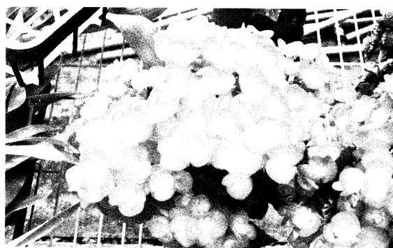
▲ 栽培適當花芽分化佳

由於麗格秋海棠屬於短日植物，夏季每天日落前遮黑幕，造成人工短日，維持9-10小時的日長2週，植株則會感受短日開始花芽分化。在自然短日下，8、9月間，植株雖有花朵發育，但花少且品質不良，主要原因為雖然日長漸短，但溫度尚高，日長也不夠短，且開花使葉生長受到抑制，造成花芽分化的營養來源不夠充足所致。前人研究秋季