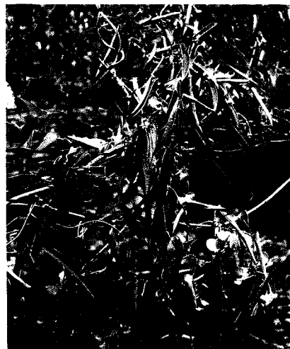
萎凋病 葉片萎凋內捲，下垂，而後黃化，植株枯死。

由镰孢菌所造成，病株初期僅在晴天萎凋，而後逐漸嚴重，並由下位葉開始黃化，最後整株枯死，病株近地面藤莖斷面或塊莖斷面可發現維管褐化之情形，切其片斷置入膠袋，1~2天後即可在斷面發現淺粉紅色，或淺紫紅色之菌絲，並可利用顯微鏡觀察到鐮刀形之病原孢子。病株在濕度高之狀況下，地際部若有傷口亦會長出同色而稀疏之菌絲，因此極易與白絹病區別。