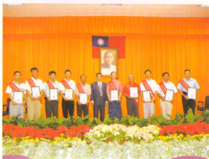
鄭場長頒獎給轄區績優農友