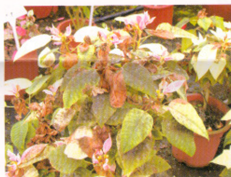
銀葉粉蝨分泌蜜露誘發煤病，影響植株外觀