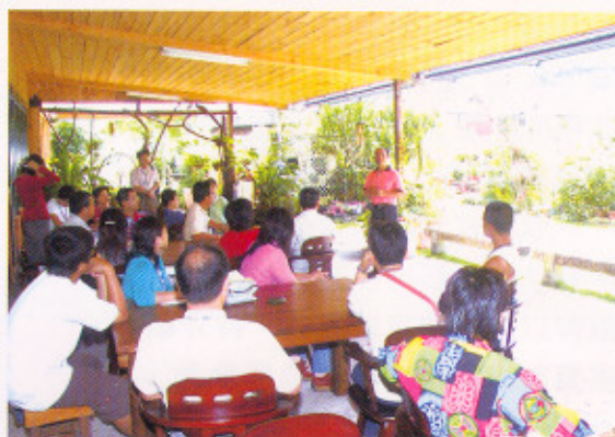
安排學員前往區內休閒農場進行觀摩研習

安排區內休閒農業經營觀摩研習，前往觀音鄉吳厝楊家莊、大溪鎮大溪保健植物園及關西鎮金勇 DIY 農場，與農場主人經驗交流。