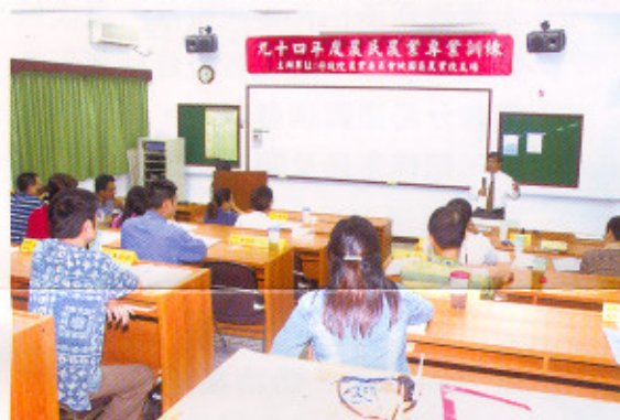
本場鄭場長隨和博士專題演講

本場於 94 年 10 月 17 至 21 日辦理農民專業訓練「休閒農業經營育成訓練班」，計有 23 名全國各地農友參加。主要課程內容有相見歡、休閒農業經營相關法規與發展方向、休閒農場經營管理、影片欣賞、綠美化植物在觀光休閒的利用、蔬果作物在休閒農業的利用、國內外休閒農業經營現況、休閒農業錄影帶觀賞與討論、保健及香草植物在休閒農業的利用、田園餐飲在休閒農業的利用、農村體驗活動設計與執行、休閒農場管理實務與行銷策略、休