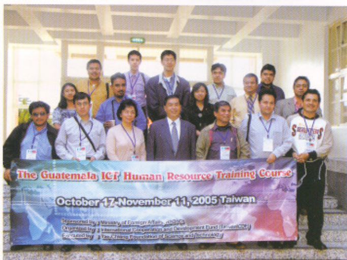
瓜地馬拉訪問團於 11 月 4 日至活動現場