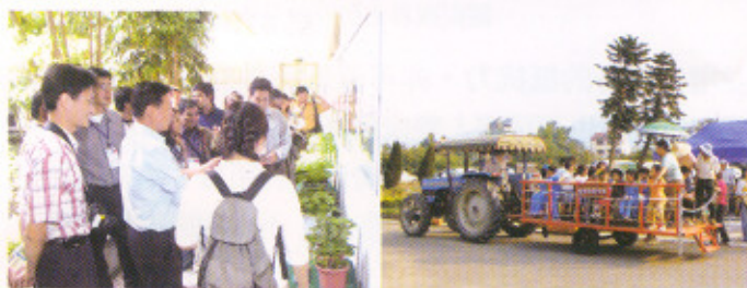
試驗研究推廣成果展導覽解說

本場為增進農友及社會各界對農業改良場服務功能與內涵之認識，11月4日、5日於台北分場辦理 94 年度第二次試驗研究推廣成果開放參觀日活動，本次活動共吸引 5100 位民眾及農民熱烈參與。