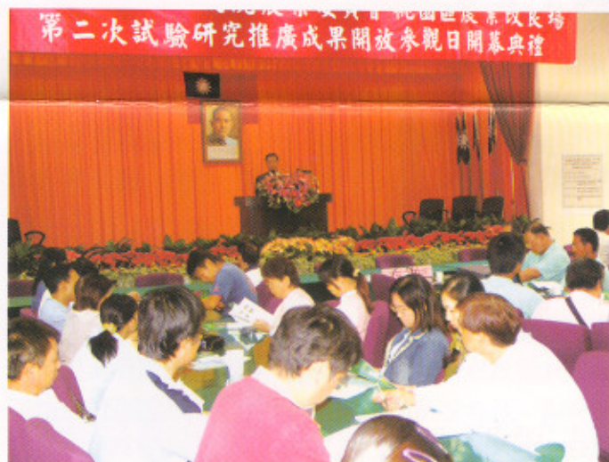
開幕典禮鄭場長隨和致詞