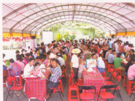
新香米桃園 3 號品嚐盛況